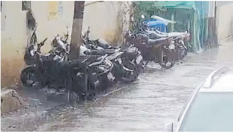
राजगढ़, विदिशा, इंदौर, झाबुआ, खंडवा, खरगोन, उज्जैन, रतलाम, आगर-आलीराजपुर, धार, बुरहानपुर, बड़वानी, मालवा, शाजापुर, देवास, नर्मदापुरम, बैतूल,

हरदा, दतिया, शिवपुरी, गुना, अशोकनगर, जबलपुर, कटनी, नरसिंहपुर, छिंदवाड़ा, पांडुर्णा, सिवनी, बालाघाट, मंडला, डिंडौरी, सतना, सीधी, मऊगंज, मैहर, शहडोल, उमरिया, अनूपपुर, सागर, पन्ना, दमोह, छतरपुर, टीकमगढ़ और निवाड़ी में 40 से 60 किमी प्रतिघंटा की रफ्तार से आंधी के साथ बारिश होने का अनुमान है। आलीराजपुर, इंदौर, हरदा, धार, बैतूल, खंडवा, बुरहानपुर, छिंदवाड़ा, पांडुर्णा, खरगोन, सिवनी, बालाघाट, मंडला, बड़वानी, डिंडौरी में मानसून के आने की घोषणा हो चुकी है। मौसम वैज्ञानिकों का कहना है कि अगले दो से चार दिन के अंदर मानसून पूरे प्रदेश में छा जाएगा। यह सबसे आखिरी में ग्वालियर-