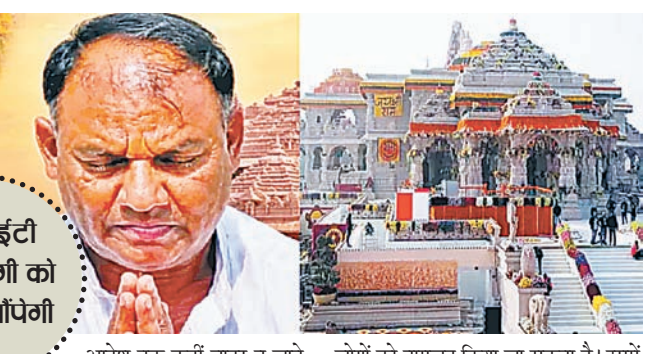
एसआईटी आज योगी को रिपोर्ट सांपेगी

राम मंदिर में चढ़ावा चोरी की जांच कर रही स्पेशल इन्वेस्टिगेशन टीम, यानी एसआईटी आज सांझ योगी को शुरूआती रिपोर्ट सांप सकती है। रविवार शाम टीम योगी से मिलने पहुंची थी, लेकिन मुलाकात नहीं हो सकी। सांझ मानसून सत्र समेत अन्य मीटिंग में व्यस्त थे। एसआईटी ने 7 पेन ड्राइव में डेटा सेव किया है। 6 दिन की जांच में 150 संदिग्धों के नाम सामने आए हैं। इनमें से 25 लोगों पर कार्रवाई हो सकती है। जिन लोगों से एसआईटी पूछताछ कर चुकी है, उन्हें अगले