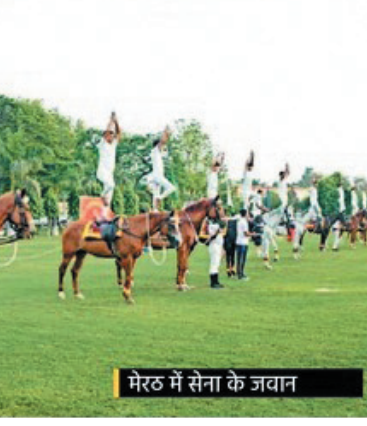
मेरठ में सेना के जवान