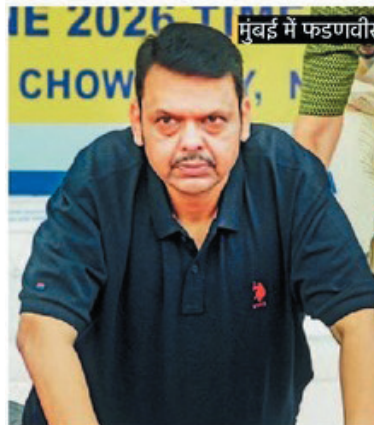
मुंबई में फडणवीस

पीएम के साथ कोलकाता के ऐतिहासिक 'रेड रोड' पर हजारों लोगों ने योग किया। पीएम ने ताड़ासन, अर्धचक्रासन, भद्रासन, त्रिकोणासन सहित 5 आसन किए। कॉमन प्रोटोकॉल योग सत्र के दौरान पीएम लोगों के बीच पहुंचे और उनकी योग मुद्राओं को सुधारने में मदद करते नजर आए। दिल्ली में 12वें अंतरराष्ट्रीय योग दिवस के कार्यक्रम में शामिल हुए केंद्रीय स्वास्थ्य मंत्री जेपी नड्डा ने कहा कि योग मानसिक जागरूकता बढ़ाता है, मन को शांत रखता है और लंबे समय तक काम करने की ऊर्जा देता है।