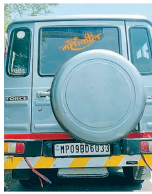
6033 ने दोनों को सीधी टक्कर मारी थी। घटनाक्रम के बाद चालक गाड़ी छोड़कर भागा है। दोनों मृतकों की पहचान के प्रयास शुरू किये गये, तभी वहां एक्त्रित हुए कुछ लोगों ने बताया कि दोनों मुरलीपुरा के रहने

चार पहिया वाहनों से हर दिन दुर्घटना शहर में पिछले कुछ समय से चार पहिया वाहनों से सड़क दुर्घटना के मामले लगातार सामने आ रहे हैं। हर 4 से 5 दिन में मौत होना और प्रतिदिन घायल लोग अस्पताल पहुंच रहे हैं। पुलिस प्रशासन द्वारा पूर्व में ब्लैक स्पॉट चिह्नित कर सुरक्षा के इंतजाम किये थे, जहां दुर्घटना का ग्राफ कम हो गया, लेकिन अन्य मार्गों पर आये दिन मामले सामने आ रहे हैं। चार पहिया वाहन रफ्तार का नियंत्रित नहीं कर पा रहे हैं। जिसके चलते कई लोगों के घरों का धिराग बुझ रहा है। वाहन चालकों को मार्गों पर वाहन की गति को नियंत्रित करना होगा, तभी दुर्घटनाओं का ग्राफ कम होगा।