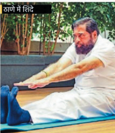
ठाणे में शिंदे