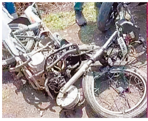
की मौत होना सामने आया। लोगों ने बताया कि भैरवगढ़ से आ रही तूफान गाड़ी क्रमांक एमपी 09 बी डी

ब्रह्मास्त्र ▶ उज्जैन नागदा-उन्हेल मार्ग मोहनपुरा ब्रिज के पास रविवार को हादसा हो गया। तेजगति से दौड़ती तूफान सीधे बाइक से जा भिड़ी। बाइक सवार 2 दोस्तों की मौके पर मौत हो गई। घटनाक्रम के बाद चालक तूफान गाड़ी छोड़ भाग निकला। पुलिस चालक का पता लगा रही है। महाकाल थाना एएसआई शंकरलाल कन्नोजिया ने बताया कि मोहनपुरा ब्रिज के पास हुई दुर्घटना की खबर मिलते ही पुलिस पहुंच गई थी। घटनास्थल पर बाइक सवार 2 युवकों