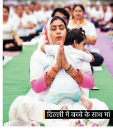
दिल्ली में बच्चे के साथ मां