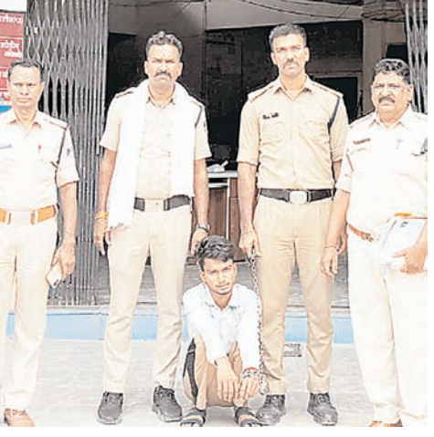
बनाया गया था। जिसकी तलाश में एक टीम भोपाल भेजी गई थी। शनिवार रात उसे गिरफ्तार कर बड़नगर लाया गया। जिसे पूछताछ के बाद रविवार दोपहर कोर्ट में पेश कर जेल भेजा गया है।