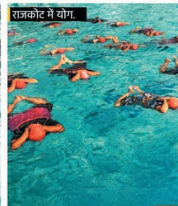
राजकोट में योग