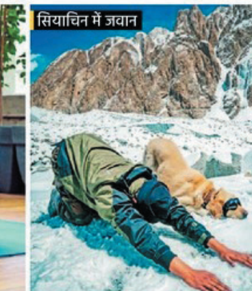
सियाचिन में जवान