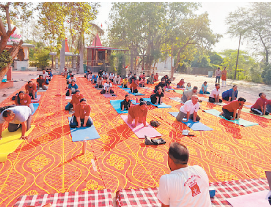
अभ्यास कराया गया। शिविर में मुख्य रूप से वजन कम करने, नौद की समस्या से निजात पाने,

अंतर्राष्ट्रीय योग दिवस कार्यक्रमों की श्रृंखला में गुरुवार को रणकेश्वर धाम में एक दिवसीय योग शिविर का आयोजन किया गया। यह शिविर महर्षि पाणिनी संस्कृत एवं वैदिक विश्वविद्यालय के योग विभाग और रणकेश्वर धाम के संयुक्त तत्वावधान में प्रातः 7 से 8 बजे तक आयोजित हुआ। आयोजन में शिवत्व योग संस्था की टीम ने साधकों को योगाभ्यास का विशेष मार्गदर्शन प्रदान किया। शिविर में योग गुरुओं ने स्वयं को स्वस्थ और निरोगी बनाए रखने के सूत्र बताए। जीवशैली से जुड़ी विभिन्न बीमारियों से पीड़ित व्यक्तियों को उनकी शारीरिक समस्याओं के अनुसार विशेष आसन और प्राणायाम का