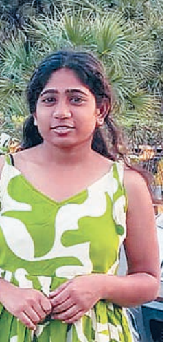
मंजिल पर पहुंचने के बाद वह अचानक नीचे गिर गई। तेज आवाज सुनकर बिल्डिंग में रहने वाले लोग बाहर आए और परिजनों को सूचना दी।

ब्रह्मास्त्र ►► इंदौर इंदौर के न्यू बर्ग कॉलोनी क्षेत्र में नीट की तैयारी कर रही एक छात्रा की चौथी मंजिल से गिरने के बाद मौत हो गई। घटना गुरुवार देर रात की है। गंभीर हालत में उसे पहले निजी अस्पताल और फिर एमवाय अस्पताल ले जाया गया, जहां उपचार के दौरान उसकी मौत हो गई। पुलिस मामले की जांच कर रही है।