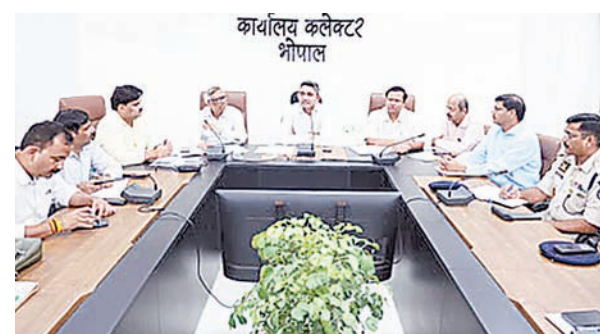
कार्यालय कलेक्टर, मोपाल नाम एक जैसे होते हैं, जिससे परीक्षार्थी कन्फ्यूज हो जाते हैं। इसलिए उन्हें केंद्र का नाम और स्थान क्लियर रखें। हमीदिया रोड पर जो सेंटर हैं, उसके रास्ते में लोग गाड़ियां खड़ी कर देते हैं। इस वजह से स्टूडेंट्स को देरी हो सकती है। इसलिए पुलिस गाड़ियों को तुरंत हटा दें। पुराने शहर में मेट्रो का काम चल रहा है। बैरिकेडिंग में सेंटर का नाम छिप सकता है। इसलिए सेंटर की ओर रास्ता दिखाने वाले बोर्ड लगेंगे।