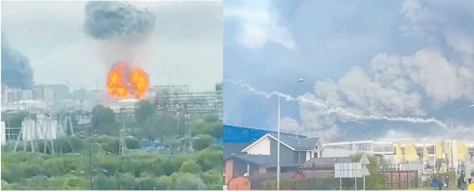
ब्रह्मास्त्र ► मॉस्को/कीव

यूक्रेन ने गुरुवार को रूस पर अब तक का सबसे बड़ा ड्रोन हमला किया। रूस के रक्षा मंत्रालय के मुताबिक, रातभर में करीब 1,000 ड्रोन और चार कूज मिसाइलों को मार गिराया गया। इनमें करीब 200 ड्रोन राजधानी मॉस्को की तरफ बढ़ रहे थे। यूक्रेन के राष्ट्रपति वोलोदिमिर जेलेंस्की ने कहा, हम यह युद्ध नहीं चाहते थे, लेकिन अगर यूक्रेन जलेगा तो मॉस्को भी जलेगा।