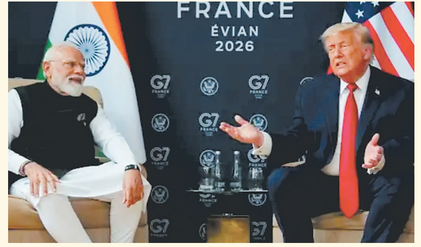
ब्रह्मास्त्र ► वाशिंगटन

अमेरिकी राष्ट्रपति डोनाल्ड ट्रम्प ने बुधवार को कहा- जब तक मैं प्रेसिडेंट हूँ, व्हाइट हाउस में मोदी का हमेशा अच्छा दोस्त मौजूद रहेगा। अगर भारत या मोदी पर हमला होता है और मोदी लीडर होंगे तो हम उनकी मदद करेंगे।