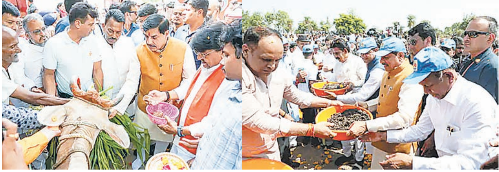
लक्ष्मीबाई को श्रद्धांजलि अर्पित की।

सीएम डॉ. मोहन यादव ने गुरुवार को इंदौर दौरे के दौरान शहर में जल संरक्षण, शिक्षा, आईटी विकास और ऐतिहासिक धरोहरों से जुड़े कई महत्वपूर्ण कार्यक्रमों में हिस्सा लिया। उन्होंने खंडवा रोड स्थित लिंबोदी तालाब पहुंचकर जल गंगा संवर्धन अभियान के तहत चल रहे जीर्णोद्धार और सौंदर्यीकरण कार्यों का निरीक्षण किया, बड़ा गणपति स्थित शासकीय शारदा कन्या स्कूल में छात्राओं से संवाद कर खगोलीय प्रयोगशाला देखी, निर्माणधीन आईटी पार्क-3 का निरीक्षण कर प्रदेश को आईटी हब बनाने का रोडमैप साझा किया, वीरगढ़ी हनुमान मंदिर की प्राचीन बावड़ी के संरक्षण के निर्देश दिए और किला मैदान पहुंचकर वीरगंगा रानी