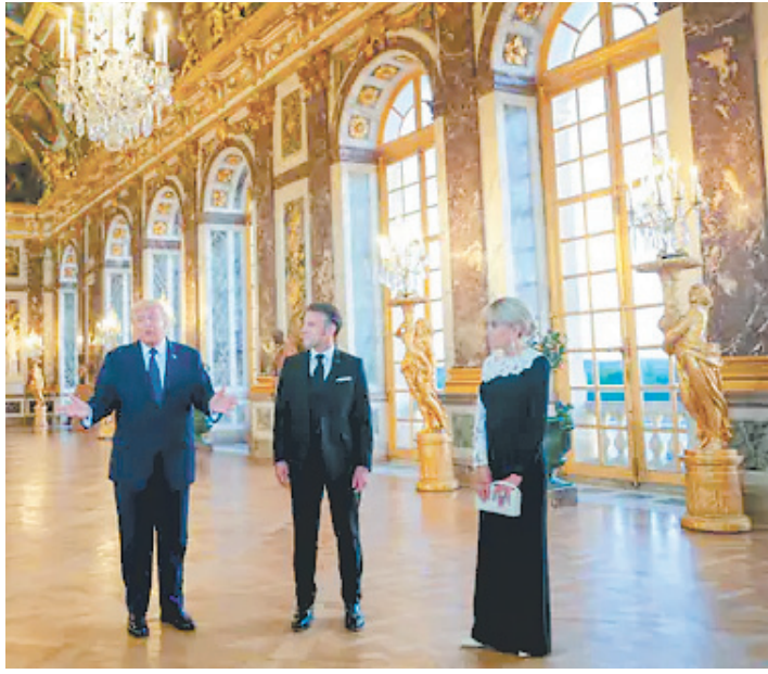
ब्रह्मास्त्र >> वाशिंगटन

अमेरिका और ईरान के बीच युद्ध खत्म करने के लिए अंतरिम समझौते पर दस्तखत हो गए हैं। ट्रंप ने बुधवार को फ्रांस के राष्ट्रपति इमैनुएल मैक्रों के साथ बैठक के दौरान पेरिस के वर्साय पैलेस में इस दस्तावेज पर साइन किए।