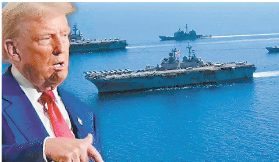
ब्रह्मास्त्र >> वाशिंगटन

अमेरिकी रक्षा मंत्रालय ने घोषणा की है कि वर इंडो-पैसिफिक कमांड का नाम बदलकर फिर से वर पैसिफिक कमांड कर दिया गया है। अब इस कमांड से 'इंडो' शब्द हटा दिया गया है।