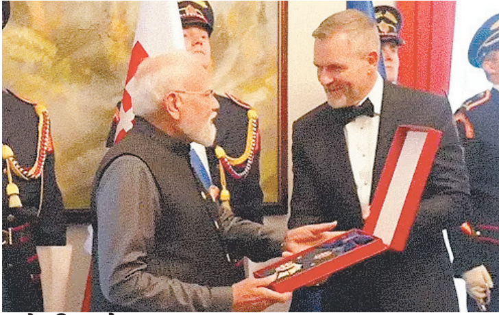
स्लोवाकिया में 9 हजार से ज्यादा भारतीय

भारत और स्लोवाकिया ने द्विपक्षीय संबंधों को हाव्यापक साझेदारी (कॉम्प्रेहेंसिव पार्टनरशिप) के स्तर तक अपग्रेड करने का फैसला किया। दोनों देशों के बीच प्रवासन, डिजिटल प्रौद्योगिकी, रक्षा, शिक्षा तथा अन्य क्षेत्रों में सहयोग बढ़ाने के लिए 11 समझौतों पर हस्ताक्षर किए।