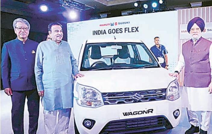
के ऑटोमोबाइल सेक्टर ने इस बदलाव को स्वीकार कर लिया है और कई बड़ी कंपनियां 100% इथेनॉल से चलने वाले वाहन बाजार में उतारने के लिए पूरी तरह तैयार हैं। गडकरी के मुताबिक, टोयोटा, सुजुकी, एमजी और हुंडई

ब्रह्मस्त्र ▶ नागपुर केन्द्र सरकार ने देश में 100% शुद्ध इथेनॉल को बतौर ईंधन इस्तेमाल करने की मंजूरी दे दी है। केंद्रीय सड़क परिवहन और राजमार्ग मंत्री नितिन गडकरी ने नागपुर में एक प्रेस कॉन्फ्रेंस के दौरान इसकी जानकारी दी। उन्होंने बताया कि इस फैसले से जुड़े नियमों और रेगुलेशंस को अंतिम रूप देने वाली फाइल पर उन्होंने साइन कर दिए हैं। इस कदम का मुख्य उद्देश्य देश की कच्चे तेल (फॉसिल फ्यूल) के इम्पोर्ट पर निर्भरता को कम करना और ट्रांसपोर्ट सेक्टर से होने वाले प्रदूषण को रोकना है। केंद्रीय मंत्री ने बताया कि देश