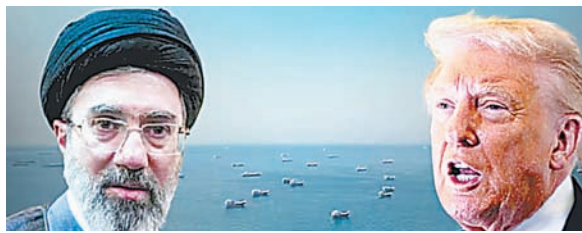
एक अमेरिकी अधिकारी ने बताया कि ट्रम्प, जेडी वेंस और ईरानी संसद अध्यक्ष मोहम्मद बाबेर गालिबाफ डिजिटल रूप से समझौते पर हस्ताक्षर कर चुके हैं। हालांकि, समझौते का पूरा मसौदा अभी सार्वजनिक नहीं किया गया है। ट्रम्प ने कहा कि दस्तावेज शुक्रवार के बाद जारी किया जाएगा।

ब्रह्मस्त्र ▶ तेल अवीव अमेरिकी राष्ट्रपति डोनाल्ड ट्रम्प ने दावा किया है कि अमेरिका-ईरान समझौता पूरा हो चुका है और इस पर शुक्रवार को स्विट्जरलैंड के जेनेवा में औपचारिक हस्ताक्षर होंगे। ट्रम्प ने कहा कि अमेरिकी डेलिगेशन की अगुआई उपराष्ट्रपति जेडी वेंस करेंगे। न्यूयॉर्क टाइम्स के मुताबिक एक अमेरिकी अधिकारी ने बताया कि ट्रम्प, जेडी वेंस और ईरानी संसद अध्यक्ष मोहम्मद बाबेर गालिबाफ डिजिटल रूप से समझौते पर हस्ताक्षर कर चुके हैं। हालांकि, समझौते का पूरा मसौदा अभी सार्वजनिक नहीं किया गया है। ट्रम्प ने कहा कि दस्तावेज शुक्रवार के बाद जारी किया जाएगा।