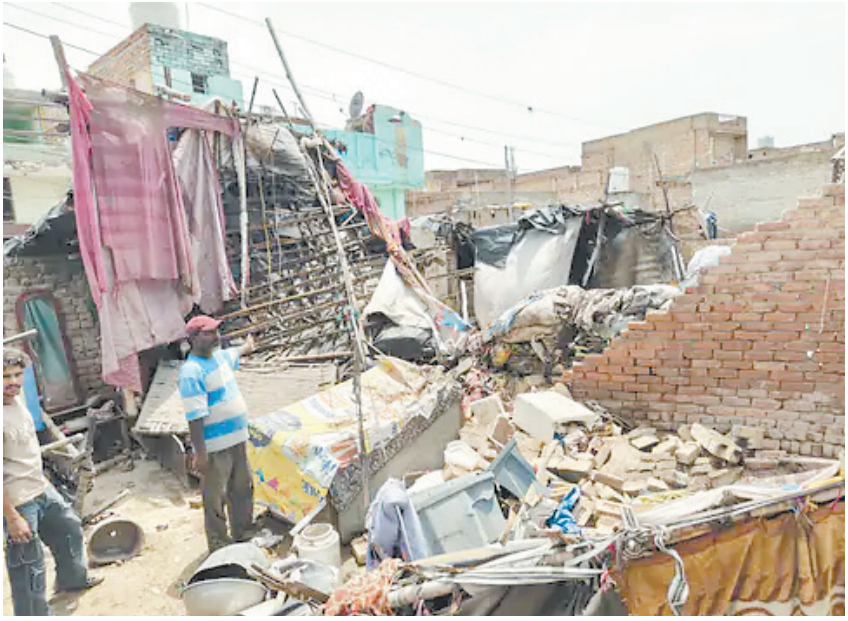
ब्रह्मास्त्र ►► भोपाल/जयपुर/लखनऊ/पटना

देश के 9 राज्यों में प्री मानसून एक्टिव है। राजस्थान समेत 9 राज्यों में बारिश हो रही है। यूपी के बदायूं में सोमवार को तेज बारिश के साथ ओले गिरे। मथुरा, गाजियाबाद, अलीगढ़ और मेरठ ममें तेज बारिश हुई। तेज आंधी में एक बड़ा पेड़ चलते आँटो पर गिर गया। हादसे में आँटो सवार युवती की मौत हो गई, जबकि चालक घायल हो गया।