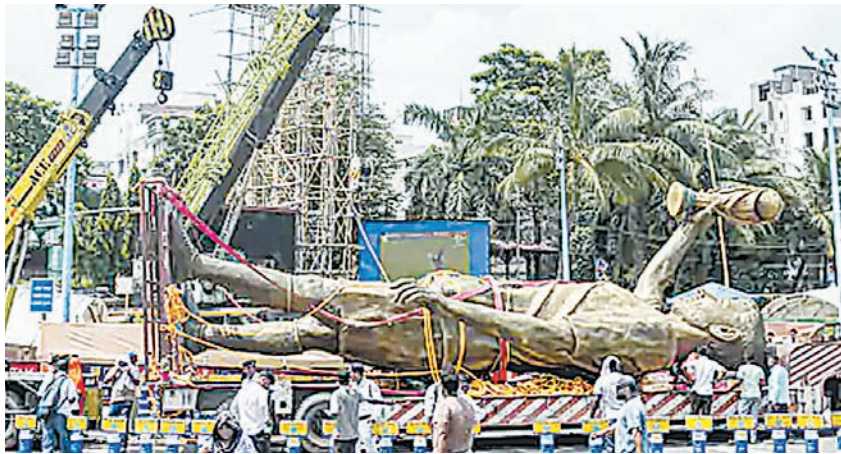
ब्रह्मास्त्र ► कोलकाता

कोलकाता के लेक टाउन इलाके में लगी स्टार फुटबॉलर लियोनेल मेसी के 70 फीट उंचे स्टेच्यू को सोमवार को हटा दिया गया। हाल में आए तेज