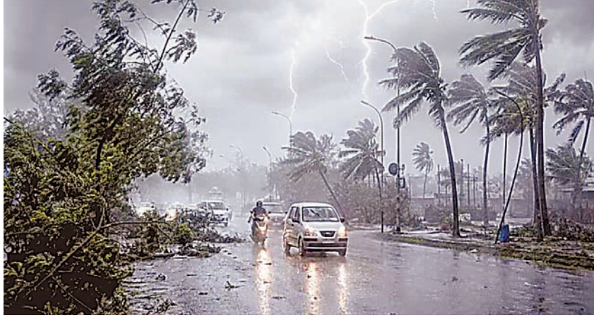
ब्रह्मास्त्र ► नई दिल्ली/भोपाल

देश के 23 राज्यों में जून की शुरूआत गर्मी से राहत लेकर आई। दिल्ली, उत्तर प्रदेश, राजस्थान, पंजाब, मध्य प्रदेश, हरियाणा और बिहार के कई इलाकों में बारिश, आंधी और ओलावृष्टि हुई। इससे तापमान सामान्य से नीचे दर्ज