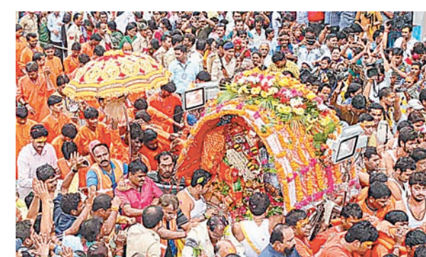
ब्रह्मास्त्र ► उज्जैन

प्रशासन सावन से पहले श्री महाकाल मंदिर क्षेत्र में चल रहे बड़ा गणेश टनल और चौबीस खंबा मार्ग को शुरू करना चाहता है। ताकि श्रद्धालुओं को तकलीफ ना हो। दरअसल सिंहस्थ की तैयारियों के क्रम में श्री महाकाल मंदिर क्षेत्र में कई निर्माण किए जा रहे हैं। इसी कड़ी में चौबीस खंबा माता मंदिर से महाकाल पार्किंग तक नई सड़क बन रही है। इसके साथ ही बड़ा गणेश के पास से वेटिंग हॉल तक टनल बनाई जा रही है।