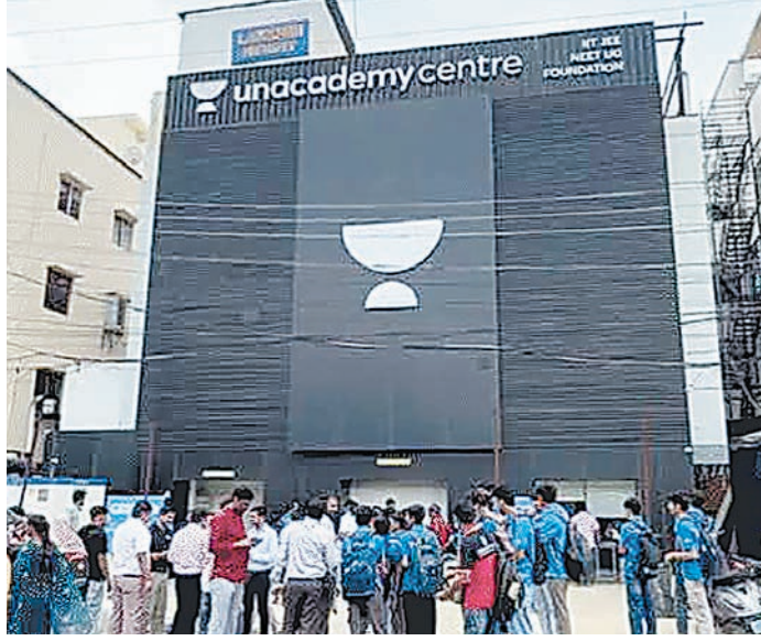
आपातकालीन निकास बंद होने से बड़ी संख्या में छात्रों के फंसने की आशंका थी। इसके बाद प्रशासन ने संस्थान को सील कर दिया।