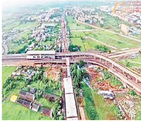
अधिसूचना जारी की गई है। प्रस्तावित मेट्रोपॉलिटन क्षेत्र की अनुमानित आबादी