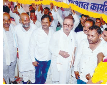
दैनिक अवन्तिका ►► उन्हेल

धाकड़ धर्मशाला में आयोजित कांग्रेस कार्यकर्ता सम्मेलन में पार्टी के वरिष्ठ नेताओं ने संपठन की मजबूती किसानों की समस्या और प्रदेश की मौजूदा परिस्थितियों को लेकर भाजपा सरकार पर जमकर हमला बोला। सम्मेलन में कांग्रेस के पूर्व प्रतिपक्ष नेता अजय सिंह ने पार्टी की अंदरूनी स्थिति पर बेबाक राय रखते हुए कहा की चुनाव आते ही कांग्रेस का हर नेता स्वयं को दवेदार मानने लगता है या किसी न किसी का पटा बन जाता है। इसी कारण कांग्रेस कई बार भाजपा से नहीं बल्कि अपने ही लोगों से चुनाव हार जाती है उन्होंने कार्यकर्ताओं से स्थानीय एवं जर्नलित के ज्वलंत मुद्दों पर सक्रियता से काम करने का आह्वान करते हुए कहा कि वर्ष 2028 के चुनाव को देखते हुए पार्टी को हर हाल में एकजुट होना