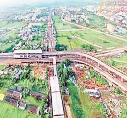
अधिसूचना जारी की गई है। प्रस्तावित मेट्रोपॉलिटन क्षेत्र की अनुमानित आबादी