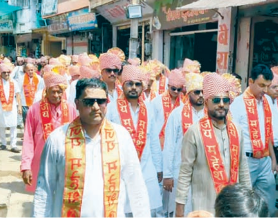
दैनिक अवन्तिका ►► आगर मालवा

आगर मालवा में महेश नवमी के अवसर पर मंगलवार को माहेश्वरी समाज ने नगर में एक चल समारोह आयोजित किया। यह शोभायात्रा दोपहर में माहेश्वरी धर्मशाला से विधि-विधान के साथ शुरू हुई। इसमें समाज की बड़ी संख्या में महिलाएँ, पुरुष, युवा और बच्चों ने पारंपरिक वेशभूषा में भगवान महेश के जयकारों के साथ भाग लिया।