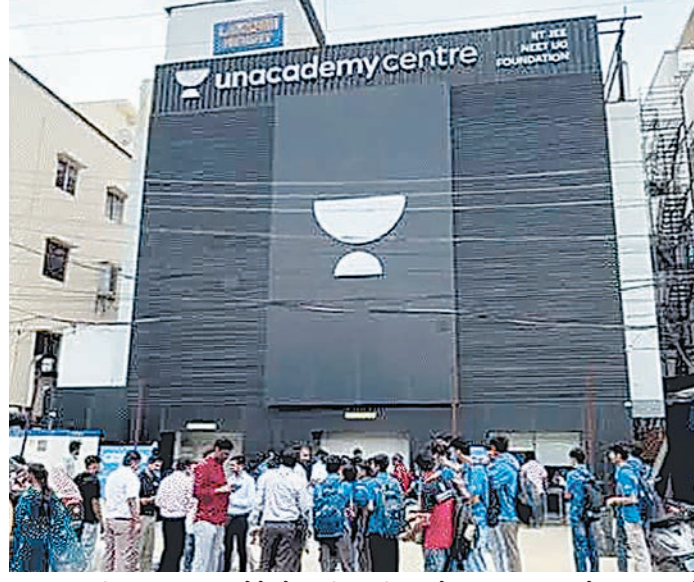
आपातकालीन निकास बंद होने से बड़ी संख्या में छात्रों के फंसने की आशंका थी। इसके बाद प्रशासन ने संस्थान को सील कर दिया।