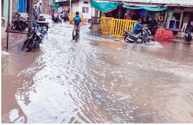
दैनिक अवन्तिका ►► सुसनेर

कर्मचारियों ने नाले का जाम हटाकर कराई पानी की निकासी