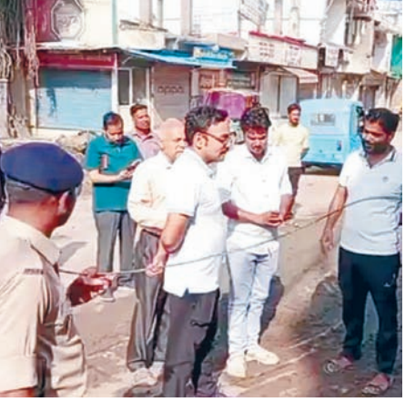
आयुक्त दिलीप कुमार ने किया निरीक्षण

देवास। देवास नगर निगम आयुक्त दलीप कुमार ने मंगलवार को एमजी रोड पर निर्माणधीन नाले के कार्य का निरीक्षण किया। उन्होंने कार्य की धीमी प्रगति पर नाराजगी व्यक्त की और टेकेदार को काम में तेजी लाने के निर्देश दिए। आयुक्त दिलीप कुमार ने बताया कि बार-बार रेटावनी के बावजूद कार्य में सुधार नहीं हुआ। इस कारण संबंधित टेकेदार पर 5 लाख रुपये का जुर्माना लगाया गया है। उन्होंने स्पष्ट किया कि परियोजना निर्धारित समय-सीमा से 15 से 20 दिन पीछे चल रही है। आयुक्त ने जांचकारी दी कि अगले 2 से 4 दिनों में सुभाष चौक तक सड़क निर्माण कार्य शुरू करने की योजना है। निर्माणधीन नाले का कार्य भी जल्द पूरा करने का प्रयास किया जा रहा है। उल्लेखनीय है कि एमजी रोड पर नाला निर्माण के कारण बारिश के दौरान स्थानीय लोगों को काफी परेशानी हो रही है। हाल ही में हुई बारिश के बाद कई स्थानों पर जलभराव और कीचड़ की स्थिति बन गई थी, जिससे व्यापारियों और राहगीरों की मुश्किलें बढ़ गई थीं। इसी समस्या के मद्देनजर आयुक्त ने मौके पर पहुंचकर स्थिति का जायजा लिया और अधिकारियों को आवश्यक दिशा-निर्देश दिए। निरीक्षण के दौरान क्षेत्र के व्यापारियों ने भी अपनी समस्याएं आयुक्त के सामने रखीं। आयुक्त ने आश्वासन दिया कि निर्माण कार्य में तेजी लाकर लोगों को जल्द से जल्द राहत प्रदान की जाएगी।