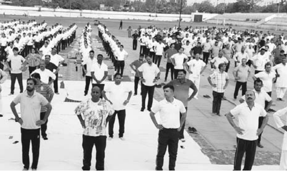
दैनिक अवन्तिका ►► व्यावरा