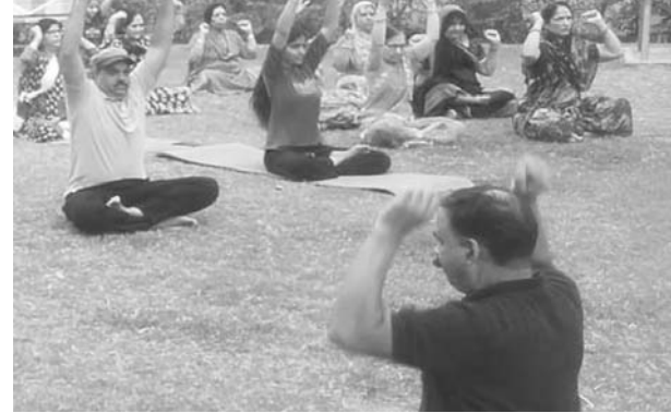
दैनिक अवन्तिका ►► व्यावरा