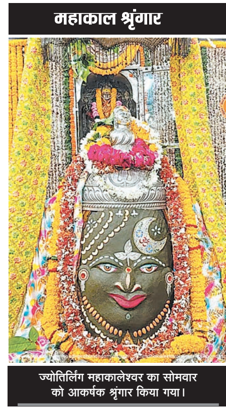
ज्योतिर्लिंग महाकालेश्वर का सोमवार को आकर्षक श्रृंगार किया गया।