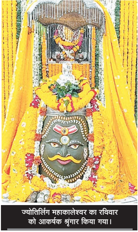
ज्योतिर्लिंग महाकालेश्वर का रविवार को आकर्षक श्रृंगार किया गया।