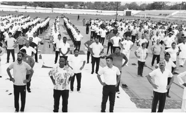
दैनिक अवन्तिका ►► व्यावरा

12वें अंतर्राष्ट्रीय योग दिवस के अवसर पर जिलेभर में उत्साह, उमंग एवं जनभागीदारी के साथ विभिन्न कार्यक्रम आयोजित किए गए। शासकीय विद्यालयों, महाविद्यालयों, कार्यालयों एवं संस्थानों में सामूहिक योगाभ्यास कर स्वस्थ जीवन का संदेश दिया गया। जिला स्तरीय मुख्य कार्यक्रम स्टेडियम ग्राउंड राजगढ़ में आयोजित हुआ, जिसमें प्रदेश शासन के मधुआ कल्याण एवं मत्स्य विकास विभाग के राज्य मंत्री नारायण सिंह पंवार मुख्य अतिथि के रूप में शामिल हुए। कार्यक्रम में जनप्रतिनिधि, अधिकारी-कर्मचारी एवं बड़ी संख्या में स्कूली विद्यार्थी उपस्थित रहे। इस अवसर पर राज्य स्तरीय योग दिवस कार्यक्रम का सीधा प्रसारण किया गया तथा उपस्थितजनों ने प्रधानमंत्री नरेंद्र मोदी के संबोधन का श्रवण किया।