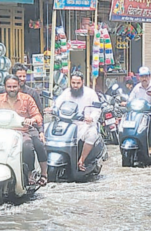
अव्यवस्था एवं समस्या उभरी- मानसून के आते ही शहर में अव्यवस्था एवं समस्याएं उभरकर सामने आ गईं। नालियों के जाम होने से शहर के विभिन्न हिस्सों में बारिश का पानी गंदगी के साथ सड़कों पर फैल गया। नए शहर के फ्रीगंज क्षेत्र में ही कई जगह यह स्थिति देखी गई। यहीं हाल पुराने शहर के कंगाल पुरा क्षेत्र में भी रही सड़कों पर आधा से एक फीट पानी भर गया था। चौड़ीकरण के क्षेत्रों में अव्यवस्था एवं समस्याओं ने मुंह फाड़ लिया था। कई क्षेत्रों में गंदगी एवं कीचड़ की स्थिति भी उभर गई थी।

शनिवार को 5 दिन से अधिक देरी से मानसून अंततः उज्जैन पर मेहरबान हुआ है। दोपहर तक कड़क धूप के बाद मौसम ने पलटा खाया और बादल छा गए। इसके बाद बादलों ने धूम मचाने का क्रम शुरू किया जो देर शाम तक जारी रहा है। मध्य दोपहर एक समय ऐसा भी रहा कि जिसमें नए शहर में सूखा देखा गया और पुराने शहर में झमाझम बारिश हो रही थी। मानसून के आगमन के साथ ही अव्यवस्था एवं समस्याओं ने मुंह खोल दिया है। शहर के कई हिस्सों में नाली का गंदा पानी सड़कों पर पसर गया। इसी अव्यवस्था एवं समस्या से दो चार होते हुए राहगीरों का आवागमन रहा है।