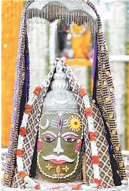
ज्योतिर्लिंग महाकालेश्वर का शनिवार को आकर्षक श्रृंगार किया गया।