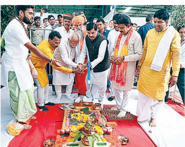
राहत मिलेगी। इस परियोजना के लिए कुल 917 किसानों की 242.939 हेक्टेयर जमीन प्रभावित

दैनिक अवन्तिका ▶▶ इंदौर इंदौर के सावेर विधानसभा क्षेत्र के चंद्रावतीगंज में इंदौर-उज्जैन ग्रीन फील्ड कॉरिडोर का भूमिपूजन किया गया। कार्यक्रम में मुख्यमंत्री डॉ. मोहन यादव और केंद्रीय शहरी विकास एवं आवास मंत्री मनोहरलाल खट्टर शामिल हैं। वहीं, जल संसाधन मंत्री तुलसीराम सिलावट भी मौजूद हैं।