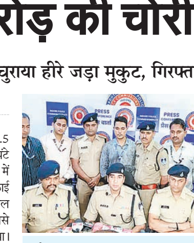
मौके का फायदा उठाकर आईफोन चोरी किया

दैनिक अवन्तिका ▶▶ इंदौर इंदौर के एक कार शोरूम में हुई 2.5 करोड़ रुपए की चोरी का पुलिस ने 48 घंटे में खुलासा कर दिया है। पुलिस ने शोरूम में पिछले एक साल से काम कर रहे सफाई कर्मचारी को गिरफ्तार कर चोरी गया माल बरामद कर लिया। आरोपी कर्मचारी ने भरोसे का फायदा उठाकर विश्वासघात किया। अपने शौक पूरे करने के लिए उसने इस वारदात को अंजाम दिया।