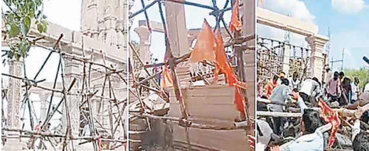
मंडप में मौजूद लोगों ने मलबा हटाया

एजेंसी ▶▶ परभणी महाराष्ट्र के परभणी जिले में यशवाड़ी देवस्थान में हनुमान मंदिर के हॉल की निर्माणधीन छत शनिवार दोपहर गिर गई। मलबे में में दबने से 7 लोगों की मौत हो गई, जबकि 25 लोग घायल हुए, जिन्हें अस्पताल पहुंचा दिया गया है।