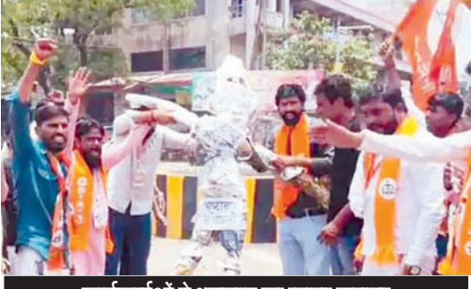
कार्यकर्ताओं ने भ्रष्टाचार का पुतला जलाया