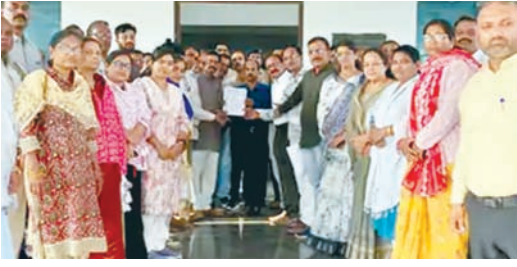
दैनिक अवन्तिका >> बदनवार