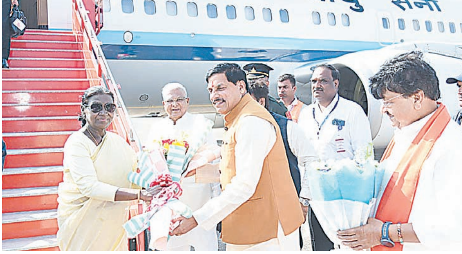
ऐतिहासिक बावड़ी का अवलोकन किया। राष्ट्रपति का यह दौरा 18 से 22 जून तक चलेगा। 19 जून को

राष्ट्रपति मुर्मू एयरपोर्ट से सीधे ओंकारेश्वर के लिए रवाना हुईं, जहां वे ज्योतिर्लिंग भगवान ओंकारेश्वर के दर्शन और पूजन किया। राष्ट्रपति के आगमन को लेकर ओंकारेश्वर और इंदौर में सुरक्षा के कड़े इंतजाम किए गए हैं। वहीं मुख्यमंत्री डॉ. मोहन यादव ने इंदौर पहुंचने पर वीर हनुमान मंदिर स्थित