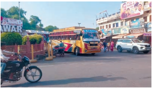
पूरे बदनावर शहर पर रहेगी तीसरी आख की नजर