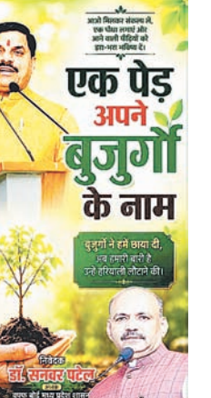
मध्यप्रदेश वक्फ बोर्ड द्वारा प्रदेश की वक्फ संपत्तियों, मस्जिदों, कब्रिस्तानों, मद्रसों एवं अन्य संस्थानों में व्यापक स्तर पर