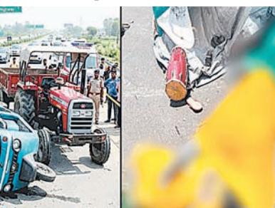
चीख-पुकार मच गई।

यह दर्दनाक हादसा उज्जाना कोतवाली क्षेत्र के अंतर्गत आने वाले बरेली-मथुरा हाईवे पर हुआ। जानकारी के अनुसार, ई-रिक्शा में