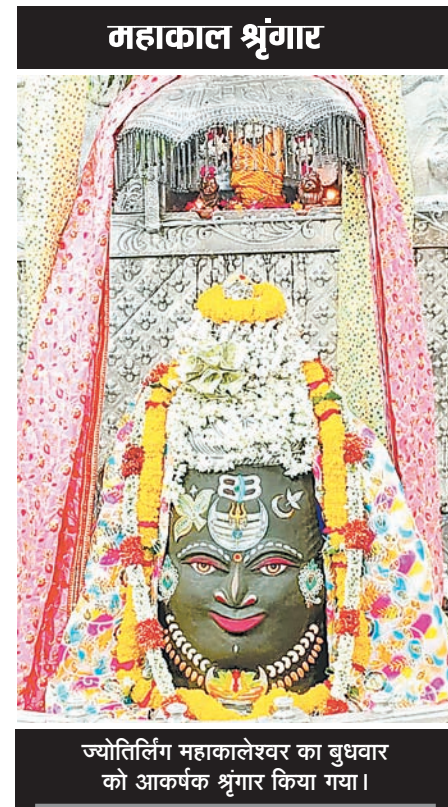
ज्योतिर्लिंग महाकालेश्वर का बुधवार को आकर्षक श्रृंगार किया गया।

ठेका एजेंसियों की लापरवाही के कारण अब तक सिंहस्थ निर्माणों में पूर्व में हो चुके हैं हादसे