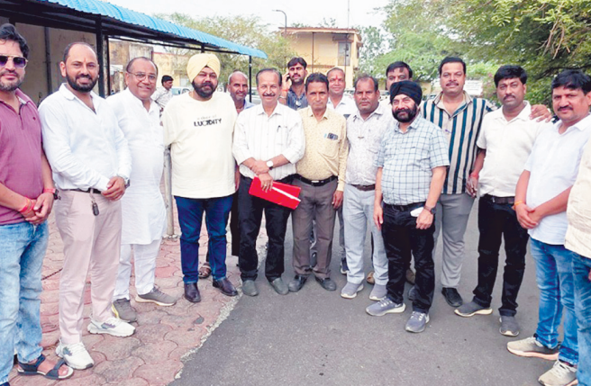
कि जिले सहित प्रदेश के कई क्षेत्रों में इस नियम को लेकर किसानों और पेट्रोल पंप संचालकों के बीच

केन्द्र सरकार द्वारा पेट्रोल एवं डीजल को केन-कूपी में नहीं दिए जाने संबंधी निर्देशों के बाद संभावित विवाद की स्थिति को देखते हुए शाजापुर पेट्रोलियम संगठन ने मंगलवार को कलेक्टर एवं खाद्य विभाग को ज्ञापन सौंपा। संगठन ने मांग की कि किसानों को होने वाली परेशानी और पेट्रोल पंप संचालकों के सामने उत्पन्न होने वाली समस्याओं के समाधान के लिए स्पष्ट दिशा-निर्देश जारी किए जाएं।