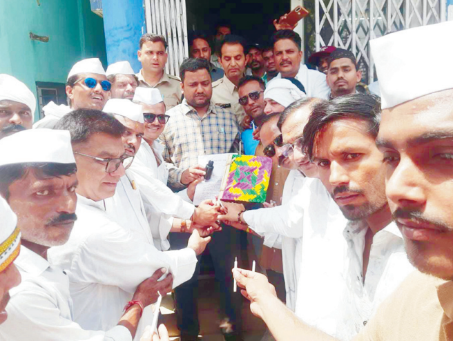
बिजली विभाग के प्रति अपना आक्रोश दर्ज कराया।

आंदोलन के दौरान कांग्रेस कार्यकर्ताओं और आक्रोशित नागरिकों ने विद्युत विभाग की तानाशाही और लचर व्यवस्था के खिलाफ जमकर नारेबाजी की। बिजली विभाग की मनमानी नहीं चलेगी, अघोषित बिजली कटौती बंद करो और जनता को राहत के लचर व्यवस्था के खिलाफ जमकर नारेबाजी की। बिजली विभाग की बिजली कटौती बंद करो और जनता को राहत दे, जवाब दो जैसे गगनभेदी नारों से पूरा मार्च गुंज उठा। पैदल मार्च के दौरान एक व्यापक हस्ताक्षर अभियान भी चलाया गया, जिसमें सैकड़ों की संख्या में स्थानीय दुकानदारों, किसानों और आम नागरिकों ने हिस्सा लेकर