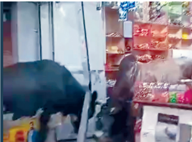
मच गई और लोग अपनी जान बचाने के लिए इधर-उधर भागने लगे।

प्रत्यक्षदर्शियों ने बताया कि दोनों सांड बस स्टैंड परिसर में अचानक आपस में भिड़ गए थे। लड़ते-लड़ते वे ऋषभ किराना दुकान तक आ पहुंचे और सीधे दुकान के शटर से जा टकराए, जिससे शटर टूट गया। सांडों को अपनी ओर आता देख आपसपास मौजूद ग्राहकों और राहगीरों में भगदड़