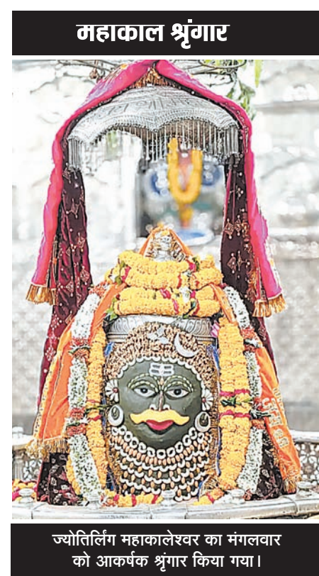
ज्योतिर्लिंग महाकालेश्वर का मंगलवार को आकर्षक श्रृंगार किया गया।