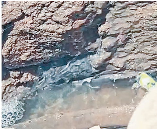
समस्याएं सामने आ रही हैं।

इंदौर में दूषित पानी की समस्या एक बार फिर सामने आई है। भागीरथपुरा के बाद अब वार्ड क्रमांक 16 के महावीर नगर में दूषित पानी से 10 लोगों के बीमार होने की जानकारी सामने आई है। इलाके के रहवासी पिछले कई दिनों से गंदे और बदबूदार पानी की शिकायत कर रहे हैं। मामले की जानकारी मिलने के बाद नगर निगम के अधिकारी मौके पर पहुंचे। उन्होंने लोगों से चर्चा कर स्थिति का जायजा लिया और पानी की सप्लाई व बोरवेल की जांच शुरू कर दी।