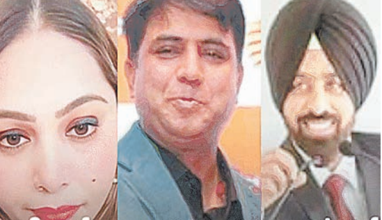
रकम दोगुनी करने का लालच देकर निवेश करवाने और बाद में पैसा वापस नहीं करने का आरोप है।