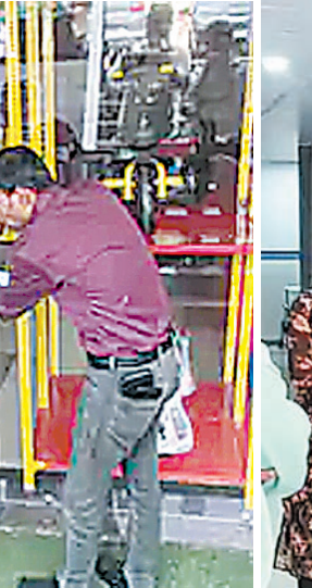
किए थे, लेकिन तब समय सीमा में नियमों का पालन नहीं होने पर अब सीलिंग की कार्रवाई की गई।