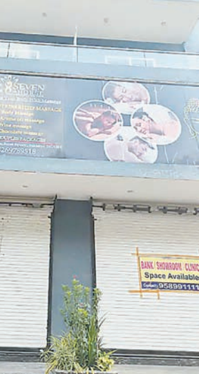
व्यवस्थाओं की जांच की। कई जगह फायर सेफ्टी उपकरण या तो मौजूद नहीं मिले या फिर वे चालू

इंदौर में फायर सेफ्टी मानकों की अनदेखी करने वाले व्यावसायिक भवनों के खिलाफ नगर निगम का अभियान लगातार जारी है। शनिवार को निगम ने सख्त कार्रवाई करते हुए शहर के 8 व्यावसायिक भवनों और संस्थानों को सील कर दिया। नगर निगम आयुक्त क्षितिज सिंघल के निर्देश पर यह विशेष अभियान शहर के सभी जोंनों में चलाया जा रहा है। इसका उद्देश्य आगजनी जैसी संभावित घटनाओं की रोकथाम करना और नागरिकों की सुरक्षा सुनिश्चित करना है। निरीक्षण के दौरान निगम अधिकारियों ने विभिन्न व्यावसायिक, संस्थागत और बहुमंजिला भवनों में लगे फायर सेफ्टी उपकरणों, अग्निशमन यंत्रों, फायर अलार्म सिस्टम, हाइड्रेंट सिस्टम और अन्य सुरक्षा