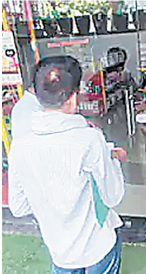
हालत में नहीं पाए गए। निगम ने पहले संबंधित भवन संचालकों को सुधार के लिए नोटिस जारी