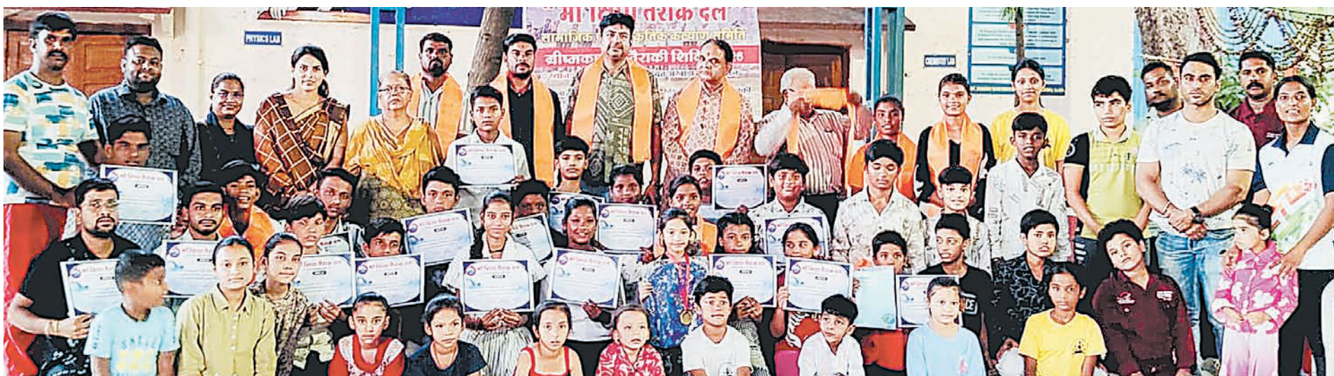
दैनिक अवन्तिका उज्जैन

माँ शिप्रा तैराक दल द्वारा चलाये जा रहे 2 माह