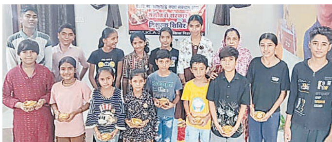
दैनिक अवन्तिका उज्जैन

गायत्री संगीत कला केंद्र एवं पंडित विष्णु नारायण भातखंडे कला संस्थान द्वारा आयोजित 11 दिवसीय निःशुल्क संगीत से संस्कार प्रशिक्षण शिविर का समापन हर्षोल्लास एवं उत्साहपूर्ण वातावरण में संपन्न हुआ। 1 जून से प्रारंभ हुए इस शिविर में बच्चों, युवाओं एवं संगीत प्रेमियों ने संगीत के साथ-साथ भारतीय संस्कृति, नैतिक मूल्यों एवं व्यक्तित्व विकास की विविध गतिविधियों में सहभागिता की। संस्था अध्यक्ष ने प्रत्येक शनिवार संस्कार शाला एवं रविवार यज्ञ एवं सूर्य