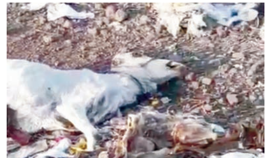
खिलचौपुर नगर परिषद बेखबर