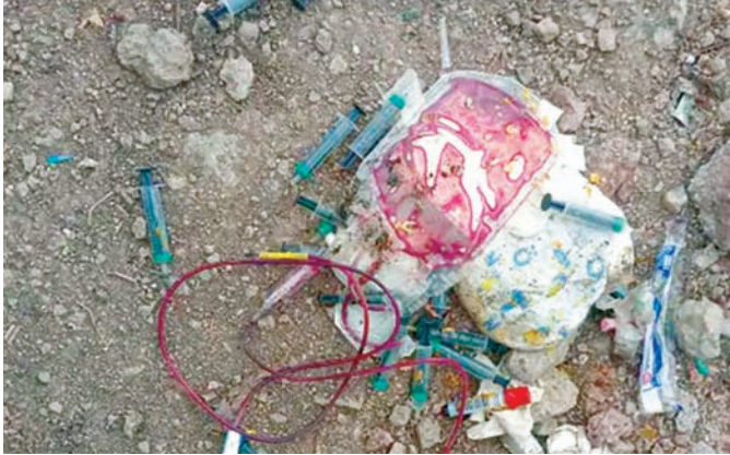
सामग्री और अन्य बायोमेडिकल वेस्ट सामान्य कचरे के साथ मिला पाया गया। यह बायोमेडिकल वेस्ट प्रबंधन नियमों का सीधा उल्लंघन है।

देवास जिला अस्पताल पर नगर निगम 50 हजार रुपए जुर्माना लगाएगा। जिला अस्पताल ने चैतावनी के बाद भी मेडिकल वेस्ट को सामान्य कचरे के साथ फेंक दिया। अस्पताल प्रबंधन ने संक्रमित मेडिकल कचरे को सामान्य कचरे के साथ मिलाकर फेंका। शुक्रवार सुबह नगर निगम की टीम के औचक निरीक्षण के दौरान इसका खुलासा हुआ। जांच में संक्रमित रक्त, इस्तेमाल की गई सुइयां और अन्य बायोमेडिकल वेस्ट सामान्य कचरे में मिला।