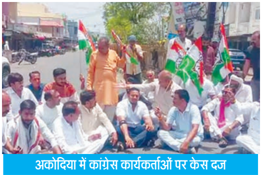
अकोदिया में कांग्रेस कार्यकर्ताओं पर केस दर्ज