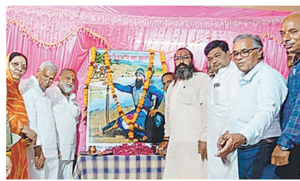
दैनिक अवन्तिका उज्जैन