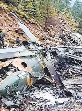
शुरूआती जानकारी के मुताबिक, ये सुरक्षाकर्मी पीओके के नीलम चाटी सेक्टर जा रहे थे। वहां पर विधानसभा की 12 आरक्षित सीटों को लेकर विवाद चल रहा है। इस वजह से सरकार वहां संसदीय सैनिक तैनात कर रही है। मुजफ्फराबाद में उड़ान भरने के बाद हेलिकॉप्टर में तकनीकी खराबी आ गई।

पाकिस्तान के कब्जे वाले कश्मीर में बुधवार को पाकिस्तान सेना का एक एमआई-17 हेलिकॉप्टर दुर्घटनाग्रस्त हो गया। हादसा मुजफ्फराबाद के पास उड़ान भरने के कुछ ही देर बाद हुआ। हेलिकॉप्टर में सवार सभी 21 सुरक्षाकर्मियों के मारे जाने की खबर है। हालांकि सेना ने अभी यह नहीं बताया है कि हेलिकॉप्टर में कुल कितने लोग सवार थे।