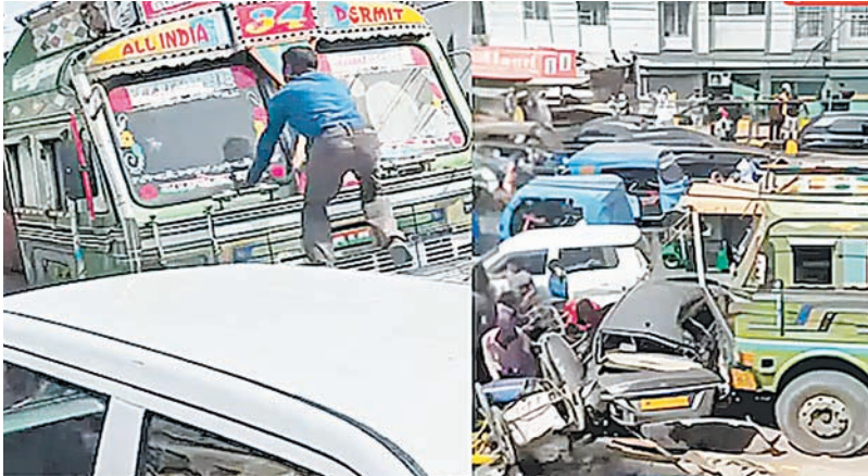
प्रत्यक्षदर्शियों के अनुसार चालक ने स्थिति को भांपते हुए टैंकर को फुटपाथ की ओर मोड़ दिया। इससे वाहन रुक गया और बड़ा हादसा टल गया। लोगों का कहना है कि यदि टैंकर आगे बढ़ता रहता तो कई और वाहन इसकी चपेट में आ सकते थे।

इंदौर के पटेल ब्रिज पर गुरुवार दोपहर नगर निगम का पानी का टैंकर बेकाबू हो गया। टैंकर को अपनी ओर आता देख लोग जान बचाने के लिए इधर-उधर भागने लगे। अनियंत्रित टैंकर ने कई कारों और बाइकों को टक्कर मार दी, जिससे 4 लोग घायल हो गए। प्रारंभिक जानकारी के मुताबिक हादसा टैंकर के ब्रेक फेल होने से हुआ। प्रत्यक्षदर्शियों ने बताया कि टैंकर अचानक अनियंत्रित हो गया और सड़क पर आगे बढ़ते हुए वाहनों को टक्कर मारता चला गया। इससे मौके पर अफरा-तफरी मच गई। हादसे से नाराज लोगों ने टैंकर में तोड़फोड़ कर दी।