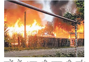
घरों में आग भी लगा दी गई। घटना कामजोंग जिले के कुलतूह

मणिपुर में गुरुवार सुबह 4.55 बजे सतिंध उग्रवादियों के कुकी समुदाय के 2 लोगों की गोली मारकर हत्या कर दी। 30 घरों में आग भी लगा दी गई। घटना कामजोंग जिले के कुलतूह