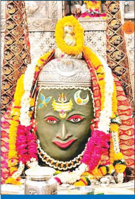
ज्योतिर्लिंग महाकालेश्वर का बुधवार को आकर्षक श्रृंगार किया गया।