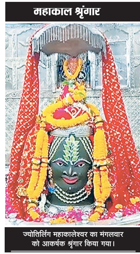
ज्योतिर्लिंग महाकालेश्वर का मंगलवार को आकर्षक श्रृंगार किया गया।