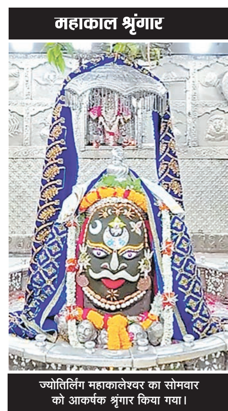
ज्योतिर्लिंग महाकालेश्वर का सोमवार को आकर्षक श्रृंगार किया गया।