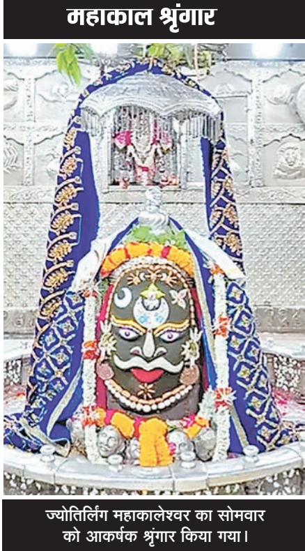
ज्योतिर्लिंग महाकालेश्वर का सोमवार को आकर्षक श्रृंगार किया गया।

श्री महाकालेश्वर मंदिर परिसर के बाहर एवं अंदर दोनों ओर बाधा ही बाधा