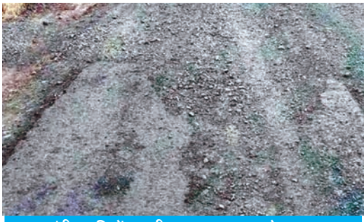
गारटी अवधि में उखड़ी करणपुरा-नाहरखेड़ा सड़क