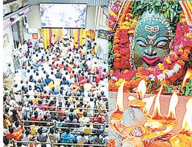
एवं मंदिर के प्रमुख अधिकारियों के पास ही रहती है। पिछले 15 दिनों के सामने आए आंकड़ों के अनुसार मई अंतिम दिवस से जून के प्रथम सप्ताह में एक भी दिन ऐसा नहीं रहा है जब कि श्रद्धालुओं का आंकड़ा डेढ़ लाख के अंदर ही सिमटा हुआ है।

दैनिक अवन्तिका ► उज्जैन ग्रोथ कालीन अवकाश के दौर में श्री महाकालेश्वर मंदिर में श्रद्धालुओं के उमड़ने का सिलसिला बना हुआ है लेकिन संख्या में अब गिरावट की स्थिति देखी जा रही है। पिछले 15 दिनों के आंकड़ों से साफ हो रहा है कि पिछले माह के अंतिम सप्ताह में दो दिन जमकर श्रद्धालु उमड़े और उन्होंने भगवान के दर्शन किए हैं। अब इनकी संख्या सामान्य बनी हुई है। श्री महाकालेश्वर मंदिर में ग्रोथकालीन अवकाश के समय देशभर से जमकर श्रद्धालुओं का आगमन हुआ है। इस दौरान एक भी दिन ऐसा नहीं रहा जब कि एक लाख से कम श्रद्धालु मंदिर में पहुंचे हों। मंदिर में स्मार्ट सिटी के तहत लगे हेड कार्टेजबिल मशीन के जरिए प्रतिदिन का आंकड़ा एकत्रित किया जाता है। जिसकी जानकारी स्मार्ट सिटी