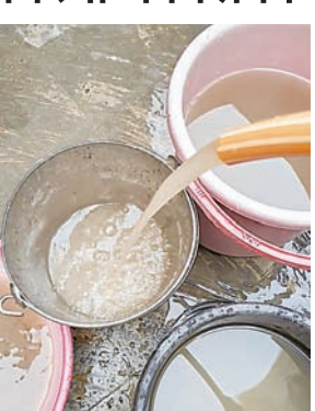
पेयजल पाइप-लाइन्स क्षतिग्रस्त हो चुकी हैं। पाइपलाइन फूटने और लीकेज होने से नालियों का गंदा पानी पेयजल लाइन में मिल रहा है, जिसके कारण घरों तक दूषित और मटमैला पानी पहुंच रहा है।

दैनिक अवन्तिका ► उज्जैन वार्ड क्रमांक 22 के दानीगेट क्षेत्र में पेयजल सप्लाई के दौरान नलों से गंदा और मटमैला पानी आने से क्षेत्रवासी परेशान हैं। पिछले कई दिनों से यह समस्या बनी हुई है, लेकिन इसके समाधान के लिए न तो संबंधित अधिकारी गंभीरता दिखा रहे हैं और न ही जनप्रतिनिधियों द्वारा कोई प्रभावी पहल की जा रही है। स्थिति यह है कि लोगों को उपयोग योग्य पानी जुटाने के लिए इधर-उधर भटकना पड़ रहा है, जबकि कई परिवारों को पीने के लिए पानी खरीदने तक की नौबत आ गई है। चौड़ीकरण कार्य के दौरान पाइपलाइन हो रही क्षतिग्रस्त- दानी गेट क्षेत्र में इन दिनों सड़क चौड़ीकरण का कार्य चल रहा है। क्षेत्र की सड़कों और नालियों की खुदाई के दौरान ठेकेदार की लापरवाही के कारण कई स्थानों पर