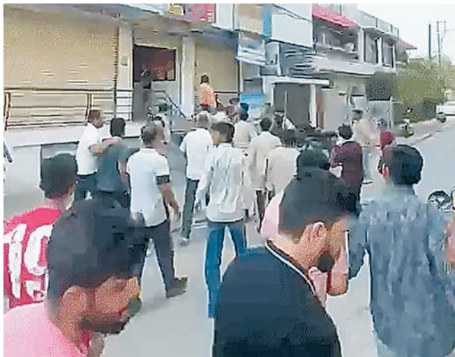
विवाद बढ़ने पर दोनों पक्ष थाने पहुंचे।