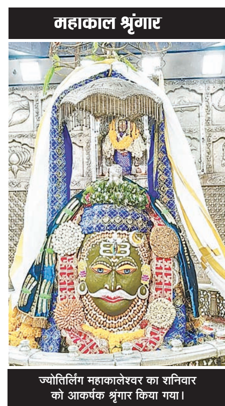
ज्योतिर्लिंग महाकालेश्वर का शनिवार को आकर्षक श्रृंगार किया गया।

पिछले 15 दिन में मात्र एक दिन दो लाख श्रद्धालुओं का आंकड़ा हुआ पार