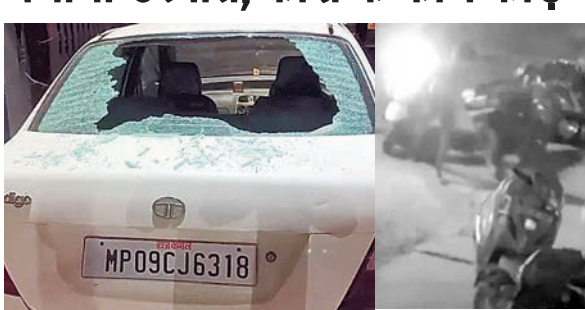
दैनिक अवन्तिका ▶▶ इंदौर