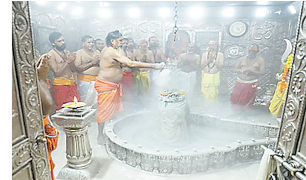
दैनिक अवन्तिका ► उज्जैन