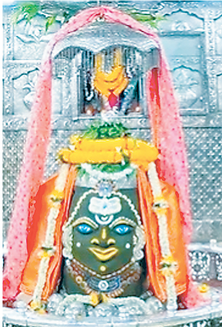
ज्योतिर्लिंग महाकालेश्वर का गुरुवार को आकर्षक श्रृंगार किया गया।