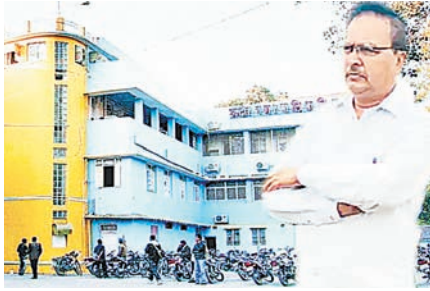
दस्तावेजों प्रमाण सामने आए हैं। जांच एजेंसी का दावा है कि सरकारी धन की हेराफेरी कर अर्जित राशि से मध्य प्रदेश और उत्तर प्रदेश में बड़ी संख्या में संपत्तियां खरीदी गईं। इसी के तहत 43 संपत्तियों को अटैच किया गया है।

ईडी की जांच में अब तक करीब 92 करोड़ रुपए की वित्तीय अनियमितताओं के