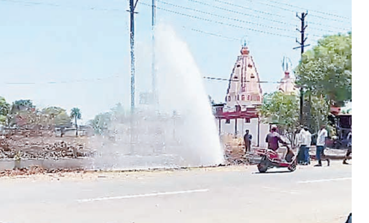
खुदाई के दौरान हुई पाइपलाइन क्षतिग्रस्त- स्थानीय लोगों के अनुसार बड़नगर रोड पर सड़क निर्माण और चौड़ीकरण का कार्य चल रहा है। इसी दौरान की गई खुदाई में ठेकेदार की लापरवाही के चलते मुख्य पेयजल पाइपलाइन क्षतिग्रस्त हो गई। यह पाइपलाइन अंबोदिया डैम से शहर में पेयजल आपूर्ति करने वाली प्रमुख लाइन बताई जा रही है।

शहर में चल रहे सड़क चौड़ीकरण कार्य के दौरान ठेकेदारों की लापरवाही के कारण पेयजल पाइपलाइन लगातार क्षतिग्रस्त हो रही हैं। मंगलवार को बड़नगर रोड स्थित हनुमानगढ़ी के समीप पंचायती अखाड़े के पास अंबोदिया डैम से आने वाली मुख्य पेयजल पाइपलाइन फूट गई। पाइपलाइन क्षतिग्रस्त होते ही तेज दबाव के साथ पानी फव्वारे चलने लग गए और कुछ ही देर में सड़क पर पानी फैल गया।