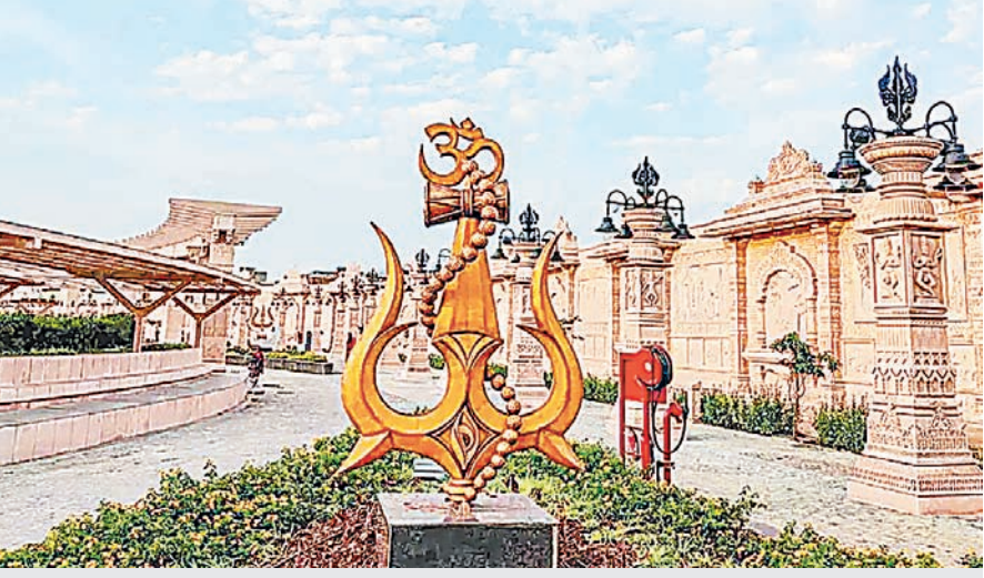
जल्द ही एयरपोर्ट बनाने को होगा भूमिपूजन

मोक्षदायिनी शिप्रा के तट पर बसी हजारों वर्षों पुरानी भगवान महाकाल की नगरी उज्जयिनी (उज्जैन) आज फिर इतिहास रच रही है। कभी सम्राट विक्रमादित्य की राजधानी और भारतीय कालगणना का केंद्र रही यह नगरी अब आधुनिक भारत के सबसे बड़े आध्यात्मिक-आर्थिक परिवर्तन की साक्षी बन रही है। श्री महाकाल महालोक के लोकार्पण के बाद उज्जैन में केवल श्रद्धालुओं की संख्या नहीं बढ़ी, बल्कि विकास की एक ऐसी धारा प्रवाहित हुई है जिसने पूरे शहर का भूगोल, अर्थव्यवस्था और भविष्य बदल दिया है।