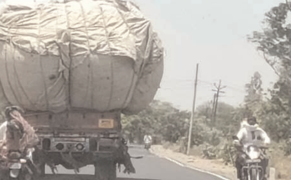
मंडरा रहा हादसों का साया

सारंगपुर के पुराने हाईवे पर इन दिनों नियमों को ताक पर रखकर भूसे का अवैध और ओवरलोड परिवहन घडल्ले से जारी है। क्षमता से कई गुना अधिक भूसा भरकर रंगते हुए निकलने वाले ये वाहन न सिर्फ रोजाना ट्रैफिक जाम की वजह बन रहे हैं, बल्कि राहगीरों और दोपहिया वाहन चालकों के लिए काल साबित हो रहे हैं।