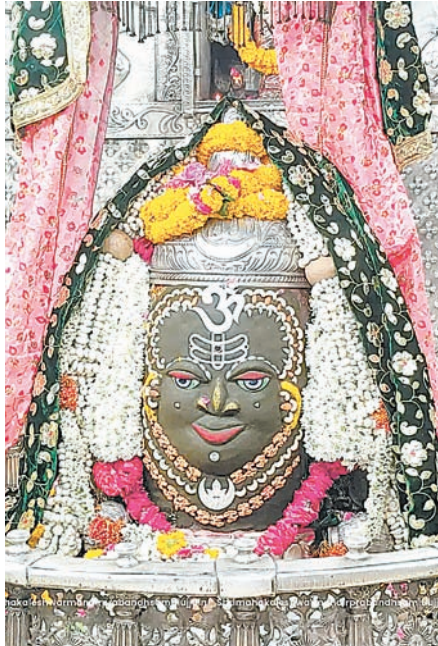
ज्योतिर्लिंग महाकालेश्वर का रविवार को आकर्षक श्रृंगार किया गया।