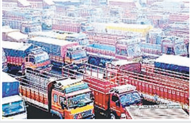
ब्रह्मास्त्र ► नई दिल्ली

वायु गुणवत्ता प्रबंधन आयोग (सीएक्व्यूएम) और दिल्ली सरकार की नीतियों के विरोध में ऑल इंडिया मोटर ट्रांसपोर्ट कांग्रेस (एआईएमटीसी) के नेतृत्व में दिल्ली-एनसीआर की 68 से अधिक परिवहन एसोसिएशनों और यूनियनों ने तीन दिवसीय चक्का जाम का एलान किया है। संगठनों का आरोप है कि पर्यावरण क्षतिपूर्ति शुल्क (ईसीसी) में भारी बढ़ोतरी और बीएस-4 कमर्शियल वाहनों पर प्रस्तावित प्रतिबंध से परिवहन उद्योग पर आर्थिक संकट खड़ा हो गया है।