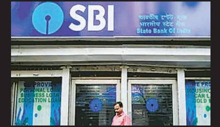
ब्रह्मास्त्र ► मुंबई