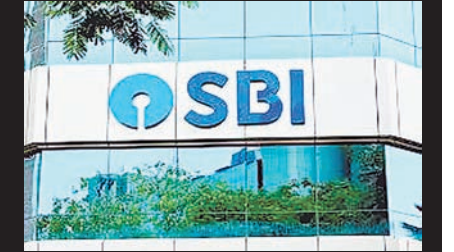
ब्रह्मास्त्र ► मुंबई

एसबीआई कर्मचारियों ने कोलकाता में 16 सूत्री मांगों के समर्थन में धरना दिया। फेडरेशन ने 25 और 26 मई को राष्ट्रव्यापी हड़ताल का आह्वान किया है। भर्ती, बीमा उत्पादों की गलत बिक्री रोकने और रिक्त पद भरने की मांगें शामिल हैं। ऑल इंडिया स्टेट बैंक ऑफ इंडिया स्टाफ फेडरेशन ने सोमवार को एक प्रमुख प्रशासनिक कार्यालय के सामने धरना दिया। यह धरना 16 सूत्री मांगों को लेकर आयोजित किया गया था। फेडरेशन ने 25 और 26 मई को भारतीय स्टेट बैंक में दो दिवसीय राष्ट्रव्यापी हड़ताल का भी आह्वान किया है।