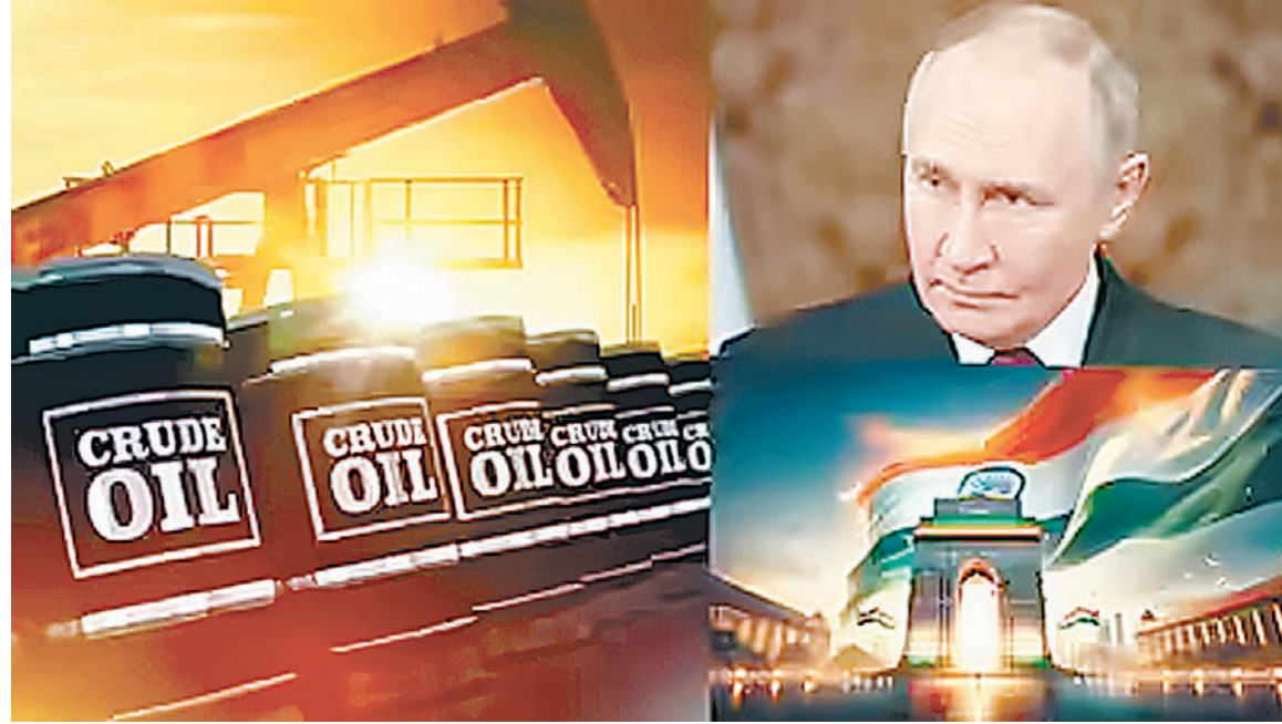
ब्रह्मास्त्र ► नई दिल्ली

ईरान संकट शुरू होने के बाद रूसी तेल और ब्रेंट क्रूड के बीच कीमतों का अंतर अब काफी कम रह गया है। मंगलवार को रूसी उराल 101-102 डॉलर और ब्रेंट क्रूड 110 डॉलर प्रति बैरल पर कारोबार कर रहा था। युद्ध से पहले फरवरी में रूसी उराल 55 डॉलर और ब्रेंट क्रूड का भाव 70 डॉलर के आसपास था।