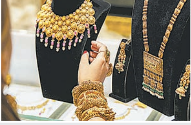
ब्रह्मास्त्र ► मुंबई

अमेरिका-ईरान तनाव कम होने से दिल्ली में सोने के दाम 800 रुपये बढ़कर 1,63,600 रुपये प्रति 10 ग्राम हो गए, जबकि चांदी 5000 रुपये गिरकर 2,71,000 रुपये प्रति किलोग्राम पर आ गई। भू-राजनीतिक स्थिरता और मोलभाव करके खरीदारी ने सोने को सहारा दिया, लेकिन वैश्विक व्याज दरों की अनिश्चितता बनी हुई है।