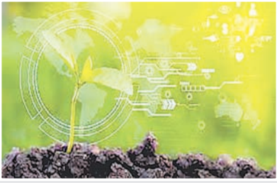
ब्रह्मास्त्र ► मुंबई

लखनऊ में 'अमर उजाला संवाद' के दौरान गोदरेज एग्रोवेट के नवनियुक्त चेयरपर्सन-डेसिग्नेट बुर्जिस गोदरेज एग्री-टेक और भारतीय कृषि के भविष्य पर अपने विचार रखेंगे।