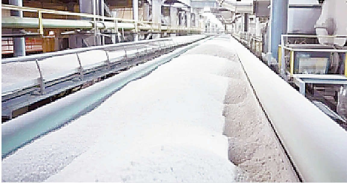
ब्रह्मास्त्र ► नई दिल्ली

भारत सरकार ने 30 सितंबर तक चीनी निर्यात पर रोक लगा दी है। सरकार के इस फैसले के बाद देश में चीनी मिलों पर 12,000 करोड़ का बकाया का भुगतान कैसे होगा इसे लेकर असमंजस पैदा हो गया है। इस बीच घरेलू बाजार में कीमतों में गिरावट का खतरा भी बढ़ गया है। एथेनॉल ब्लेंडिंग और किसानों पर इसके प्रभाव का पूरा असर समझने के लिए पढ़ें रिपोर्ट।