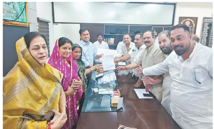
शहर के कई क्षेत्रों में पेयजल आपूर्ति पूरी तरह ठप पड़ी है।