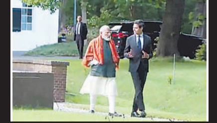
ब्रह्मास्त्र ► मुंबई

प्रधानमंत्री नरेंद्र मोदी अपने विदेश दौरे के दौरान स्वीडन में वोल्वो के मुख्यालय भी जा सकते हैं। उनकी इस यात्रा को दोनों देशों के बीच रक्षा और व्यापारिक रिश्ते के लिहाज से अहम माना जा रहा है। वोल्वो के अधिकारी पीएम मोदी के आगमन से उत्साहित हैं। चार देशों की यात्रा पर यूरोप गए प्रधानमंत्री नरेंद्र मोदी स्वीडन के समकक्ष उल्फ क्रिस्टर्सन के निमंत्रण पर इस देश का दौरा भी करेंगे। अपनी विदेश यात्रा के तीसरे चरण में स्वीडन आगमन के बाद पीएम मोदी गोथेनबर्ग में वोल्वो के मुख्यालय भी जा सकते हैं। दोनों देशों के बीच अहम समझौते होने की उम्मीद है।