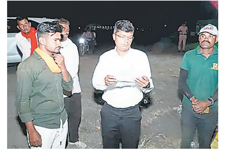
समिति प्रबंधक ने बताया कि चिकली उपार्जन केंद्र पर अब तक 665 किसानों से 39,365 क्विंटल गेहूं की खरीदी की जा चुकी है। किसानों को 10 करोड़ 33 लाख रुपए से अधिक का भुगतान भी किया गया है। केंद्र पर 900 से अधिक बारदाना उपलब्ध है, जिससे खरीदी प्रक्रिया सुचारु रूप से चल रही है। केंद्र पर तौल का कार्य सुबह 8 बजे से रात 8 बजे तक लगातार जारी रहता है। कलेक्टर के निरीक्षण के समय भी रात में तुलनाई का काम चल रहा था, जो केंद्र की सक्रियता को दर्शाता है।