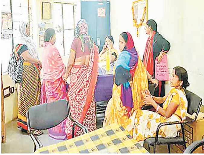
कनेक्शन दिए थे, लेकिन जल प्रदाय के समय पर्याप्त प्रेशर नहीं बन पाता। क्षेत्र ऊँचाई पर होने से पानी टंकी से घूमकर आता है और मौजूदा कनेक्शन छोटी पाइपलाइन से जुड़ा होने के कारण सप्लाई बाधित रहती है। रहवासियों का कहना है कि उनके क्षेत्र से करीब 100 मीटर दूरी पर मुख्य पाइपलाइन मौजूद है। यदि वहाँ से सीधा कनेक्शन दिया जाए तो पूरे इलाके की समस्या दूर हो सकती है।

स्थानीय लोगों ने बताया कि कम्प्यूनिटी हॉल में इन दिनों शादियाँ होने के कारण वहाँ से पानी भरना भी मुश्किल हो रहा है। रहवासियों के अनुसार उनके घरों में सालों पहले नल