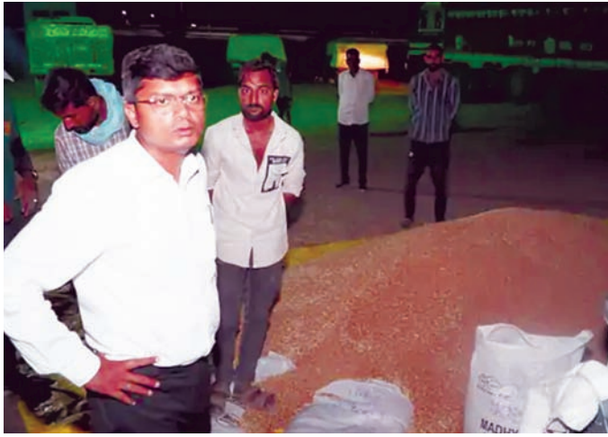
कलेक्टर ने खरीदे गए गेहूं के तुरंत परिवहन पर भी जोर दिया। उन्होंने कहा कि केंद्रों पर अनावश्यक स्टॉक जमा न होने दिया जाए, जिससे भंडारण और सुरक्षा संबंधी समस्याएं न हों। निरीक्षण के दौरान कलेक्टर ने मौके पर मौजूद किसानों से भी

कलेक्टर सिंह देर रात केंद्र पर पहुंचे और वहां की व्यवस्थाओं का बारीकी से जायजा लिया। उन्होंने समिति प्रबंधक से तौल कांटों की संख्या और उनके संचालन की स्थिति के बारे में जानकारी ली। इस दौरान कलेक्टर ने स्पष्ट किया कि उपार्जन प्रक्रिया पूरी तरह पारदर्शी होनी चाहिए। उन्होंने निर्देश दिए कि स्लॉट बुकिंग के आधार पर आने वाले किसानों की तुलनाई निर्धारित समयसीमा में ही पूरी की जाए, ताकि उन्हें अनावश्यक इंतजार न करना पड़े।