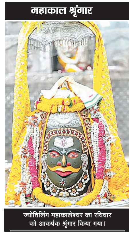
ज्योतिर्लिंग महाकालेश्वर का रविवार को आकर्षक श्रृंगार किया गया।