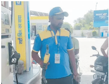
अमेरिका-ईरान जंग की वजह से कच्चे तेल में उतार-चढ़ाव बना हुआ है। इससे निपटने के लिए नीति निर्माताओं के पास

भारत में 9 दिन में तीन बार पेट्रोल-डीजल के दाम बढ़ चुके हैं। कल 23 मई को 19 मई को दामों में एप्रैक्स 90 पैसे प्रति लीटर की बढ़ोतरी की गई थी। इससे पहले 15 मई दाम 3 रुपए बढ़े थे।