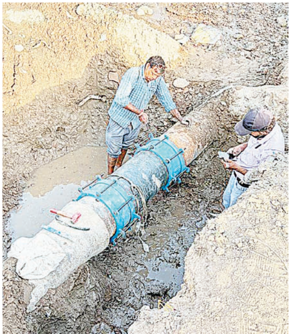
दैनिक अवन्तिका ▶ उज्जैन

भू-जल स्तर कम होने से हांफे नलकूप एवं हैंडपंपों पर लाइन लगी