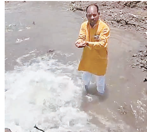
दैनिक अवन्तिका ▶ उज्जैन

भाजपा पार्षद ने पानी में उतरकर किया विरोध प्रदर्शन, क्षेत्र में जल संकट गहराया