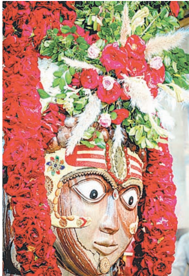
बाबा पशुपतिनाथ का फूलों का श्रृंगार।