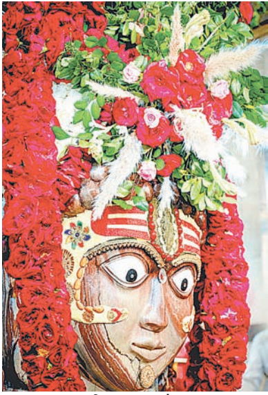
बाबा पशुपतिनाथ का फूलों का श्रृंगार।