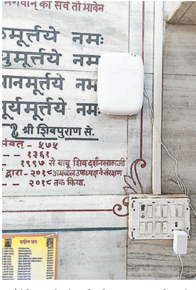
आटोमैटिक मशीन के जरिए किया जा रहा सुगंधित स्प्रे।