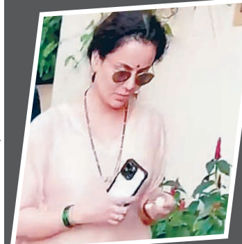
गुपचुप शादी की खबरों पर एक्ट्रेस ने दी सफाई बोली- शूटिंग लुक था, सांक्रैट मैरिज नहीं करूंगी

मुंबई। एक्ट्रेस और बीजेपी सांसद कंगना रनौत का हाल ही में एक वीडियो सामने आया है। इस वीडियो में कंगना मांग में सिंदूर, मले में मंगलसूत्र और हाथों में हरी चूड़ियां पहने नजर आ रही हैं। वीडियो वायरल होने के बाद फैंस के बीच कंगना के गुपचुप शादी करने की अफवाह चल रही है। हालांकि, यह उनके किसी असल शादी का लुक नहीं है। अब कंगना ने खुद इस अफवाह पर सफाई दी है। कंगना का यह पारंपरिक लुक उनकी आने वाली फिल्म 'कविता 2' की शूटिंग का हिस्सा है, जिसकी शूटिंग शुरू हो चुकी है। कंगना ने कहा है की वे गुपचुप शादी नहीं करेंगी। कंगना ने इन अफवाहों पर स्पष्टीकरण देते हुए अपनी इंस्टाग्राम स्टोरी पर लिखा है 'हर दिन शाहर में और उसके आसपास शूटिंग कर रही हूँ, किसी ने फेकटुर मेकअप के साथ यह रैंडम तस्वीर विलक कर दी और अब मुझे इतने सारे फोन कॉल्स आ रहे हैं, लेकिन शादीशुदा महिला के लुक में ऐसी क्या बड़ी बात है? एक्ट्रेस हर तरह के रोल निभाते हैं, मैं गुपचुप शादी नहीं करूंगी, मैं वादा करती हूँ। सोशल मीडिया पर वीडियो वायरल कई इंस्टाग्राम पेजों ने कंगना रनौत का यह वीडियो शेयर किया था। इसमें कंगना पिक कलर के पारंपरिक सूट में एक शादीशुदा महिला के रूप में दिखाई दे रही हैं। वीडियो के साथ कोई कैप्शन या जानकारी नहीं दी गई थी। इसके बाद इंस्टाग्राम और एक्स पर यूजर्स ने कमेंट करना शुरू कर दिया कि कंगना ने गुपचुप शादी कर ली है। कंगना या उनकी टीम की तरफ से तुरंत कोई सफाई नहीं आने से यह चर्चा इंटरनेट पर और बढ़ गई।