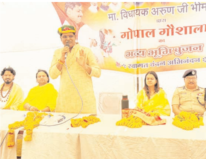
देने का आह्वान किया। परिसर में बनेगा तालाब, होगी मजबूत फेंसिंग -गौशाला को आधुनिक और सुरक्षित बनाने के लिए विशेष रूपरेखा तैयार की गई है। जानकारी के अनुसार, विशाल गौशाला परिसर में गौवंश की सुरक्षा के लिए मजबूत तार फेंसिंग की जाएगी।

जनसमूह को संबोधित करते हुए कहा कि, गौ सेवा हमारी भारतीय संस्कृति और सनातन परंपरा की आत्मा है। जहाँ गौ माता का सम्मान होता है, वहाँ सुख, समृद्धि और संस्कारों का वास होता है। उन्होंने जोर देते हुए कहा कि गौशाला का निर्माण केवल गौवंश का संरक्षण नहीं है, बल्कि यह समाज में सेवा, संस्कार और मानवता को सशक्त करने का एक पवित्र माध्यम है। गौ सेवा से बढ़कर कोई पुण्य और गौ रक्षा से बढ़कर कोई धर्म नहीं है। वरिष्ठजनों और समाजसेवियों से की मार्मिक अपील -विधायक ने समाज के उन लोगों विशेषकर वरिष्ठजनों से गौ सेवा में आगे आने का आग्रह किया, जो अपने पारिवारिक एवं सामाजिक दायित्वों से मुक्त होकर निस्वार्थ भाव से सेवा कार्य करना चाहते हैं। उन्होंने किसानों, समाजसेवियों, गौ भक्तों और क्षेत्रवासियों से गौशाला के निर्माण एवं सुचारु संचालन में बढ़-चढ़कर अपना सहयोग