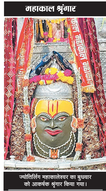
ज्योतिर्लिंग महाकालेश्वर का बुधवार को आकर्षक श्रृंगार किया गया।