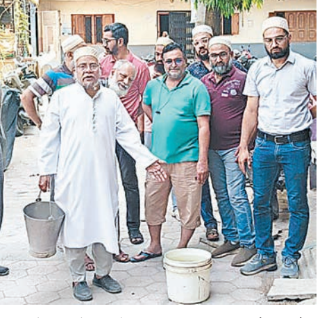
लेकर पीने तक के पानी का संकट खड़ा हो गया है। मजबूरी में रहवासियों को आसपास से पानी जुटाना पड़ रहा है या पैसे देकर खरीदना पड़ रहा है।

केडी गेट क्षेत्र के तैय्यबी मोहल्ले में मंगलवार को कम दबाव और गंदे पानी की समस्या को लेकर रहवासियों ने जमकर विरोध प्रदर्शन किया। नाराज लोग बाल्टी और बर्तन लेकर सड़क पर उतर आए और पीएचई विभाग के खिलाफ नारेबाजी की। 15 दिन से गहराया जलसंकट- क्षेत्रवासियों का कहना है कि पिछले 15 दिन से मोहल्ले में जलसंकट बना हुआ है। पीएचई द्वारा सप्लाई के दौरान कई घरों में नलों से पानी ही नहीं पहुंच रहा। जिन घरों में पानी आ रहा है, वह मटमला और बदबूदार होने की वजह से उपयोग लायक नहीं है। खरीदकर पीना पड़ रहा पानी - स्थानीय लोगों ने बताया कि मंगलवार सुबह कई घरों में पानी नहीं पहुंचा इससे खाना बनाने से