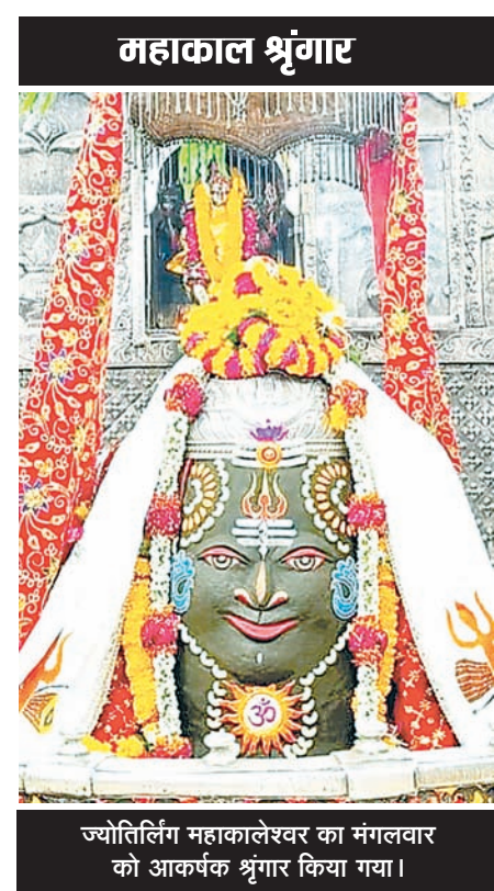
ज्योतिर्लिंग महाकालेश्वर का मंगलवार को आकर्षक श्रृंगार किया गया।