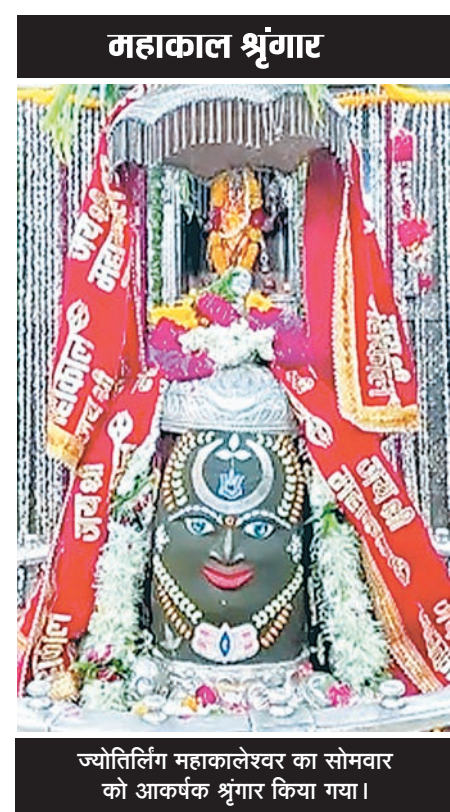
ज्योतिर्लिंग महाकालेश्वर का सोमवार को आकर्षक श्रृंगार किया गया।