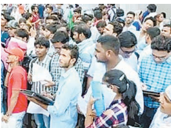
कड़ा कदम उठाना पड़ा।

प्रदेश के बेरोजगार युवाओं के लिए बेहद निराश करने वाली खबर सामने आई है। राज्य में जहां एक तरफ पंजीकृत बेरोजगारों की संख्या 25 लाख के पार पहुंच चुकी है और युवा लगातार नई भर्तियों की मांग कर रहे हैं, वहीं दूसरी तरफ सरकार ने एक बड़ा प्रशासनिक फैसला लेते हुए 1 लाख 20 हजार से अधिक पदों को हमेशा के लिए समाप्त कर दिया है।