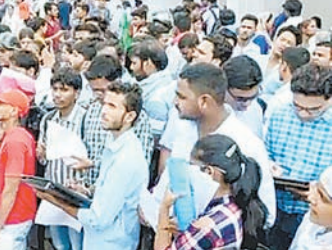
कड़ा कदम उठाना पड़ा।

प्रदेश के बेरोजगार युवाओं के लिए बेहद निराश करने वाली खबर सामने आई है। राज्य में जहां एक तरफ पंजीकृत बेरोजगारों की संख्या 25 लाख के पार पहुंच चुकी है और युवा लगातार नई भर्तियों की मांग कर रहे हैं, वहीं दूसरी तरफ सरकार ने एक बड़ा प्रशासनिक फैसला लेते हुए 1 लाख 20 हजार से अधिक पदों को हमेशा के लिए समाप्त कर दिया है।