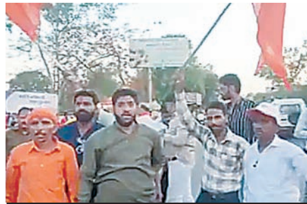
भोजशाला फेसले के बाद देवास में मनाया जश्न