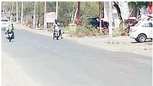
43 डिग्री पहुंचा तापमान, लू के मरीज बढ़े