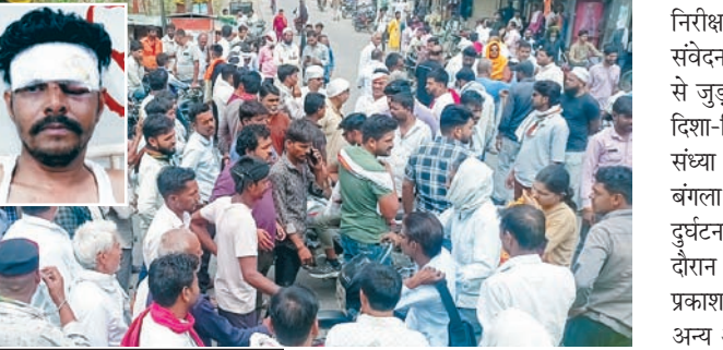
पान मसाला मांगने पर हुआ विवाद

सिटी स्थित फल सब्जी मंडी में बीती रात उपज लेकर आए दो युवा किसानों क साथ मारपीट की घटना हुई, जिसमें इन किसानों को गंभीर चोटें आईं। इस मामले ने बुधवार की सुबह तुल पकड़ लिया और सब्जी मंडी में आए किसान के साथ ही व्यापारियों ने मारपीट की घटना के विरोध और आरोपियों की शिनाख्त तथा गिरफ्तारी की मांग को लेकर पंचोर शुजालपुर हाइवे जाम कर दिया, जिसके चलते लगभग आधे घंटे तक अस्पताल चौराहे पर आवागमन बाधित रहा।