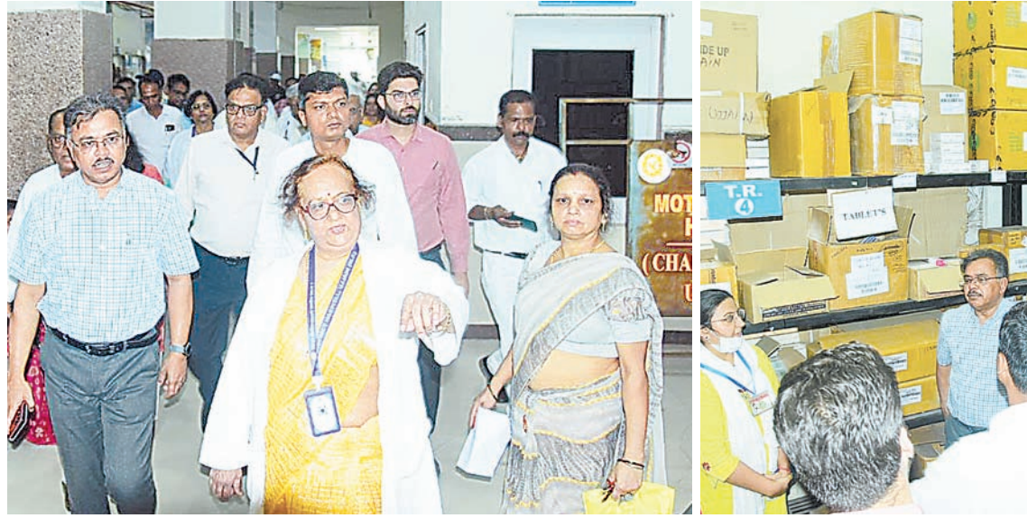
दैनिक अवन्तिका उज्जैन