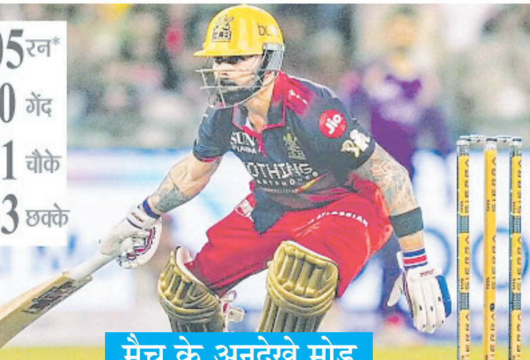
मैच के अनदेखे मोड़

यहां तक कि खिलाड़ियों की ट्रेन टिकट भी कम्पर्स नहीं थीं। साथ ही उनसे यह भी कहा गया कि खाना कम खाएं और इसी पैसे में गुजारा कर लें। खिलाड़ी ने कहा, हमने कुछ नहीं खाया। जब मैनेजर