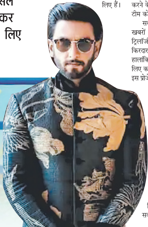
वह मार्च 2027 में आदित्य धर की अगली फिल्म की शूटिंग शुरू कर सकते हैं।