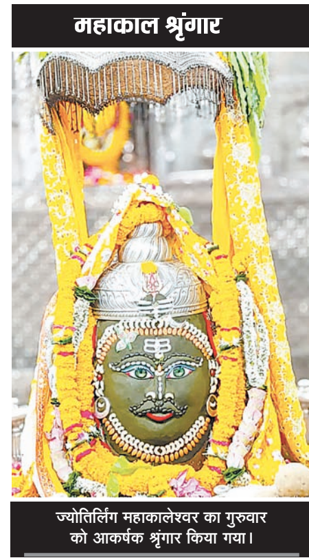
ज्योतिर्लिंग महाकालेश्वर का गुरुवार को आकर्षक श्रृंगार किया गया।