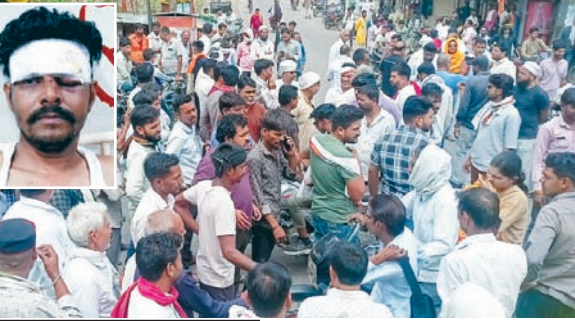
पान मसाला मांगने पर हुआ विवाद

सिटी स्थित फल सब्जी मंडी में बीती रात उपज लेकर आए दो युवा किसानों क साथ मारपीट की घटना हुई, जिसमें इन किसानों को गंभीर चोटें आईं। इस मामले ने बुधवार की सुबह तुल पकड़ लिया और सब्जी मंडी में आए किसान के साथ ही व्यापारियों ने मारपीट की घटना के विरोध और आरोपियों की शिनाख्त तथा गिरफ्तारी की मांग को लेकर पंचोर शुजालपुर हाइवे जाम कर दिया, जिसके चलते लगभग आधे घंटे तक अस्पताल चौराहे पर आवागमन बाधित रहा।