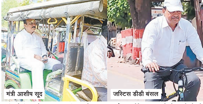
मंत्री आशीष सूद जस्टिस डीडी बंसल

प्रधानमंत्री नरेंद्र मोदी के पेट्रोल-डीजल का कम इस्तेमाल करने की अपील के बाद गृह मंत्री अमित शाह और केंद्रीय स्वास्थ्य मंत्री जेपी नड्डा ने अपने काफिले में गाड़ियों की संख्या आधी कर दी है। पीएम ने काफिलों में इलेक्ट्रिक गाड़ियां शामिल करने और गैरजरूरी वाहनों को हटाने के निर्देश दिए हैं। बुधवार को उनके काफिले में 2 गाड़ियां नजर आईं। गुजरात और असम दौरे में भी उनका काफिला छोटा रहा था।