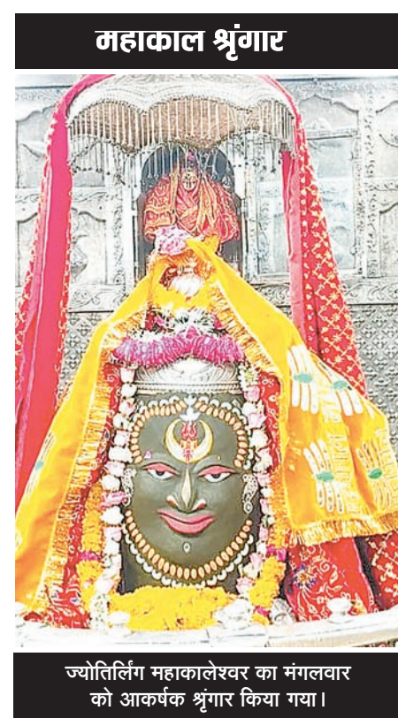
च्योतिर्लिंग महाकालेश्वर का मंगलवार को आकर्षक श्रृंगार किया गया।