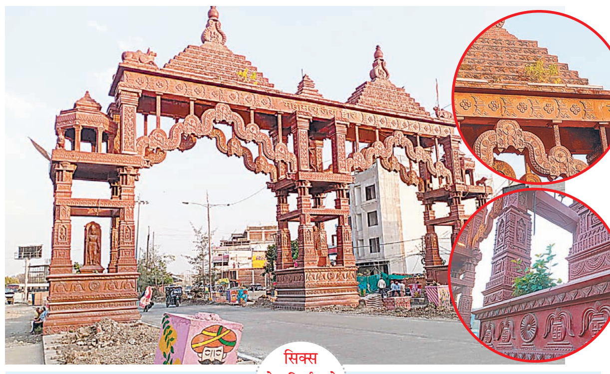
वर्तमान में इंदौर रोड पर सिक्स लेन सड़क निर्माण का कार्य चल रहा है। सड़क खुदाई और निर्माण कार्य के कारण लगातार धूल उड़ रही है, जो द्वार के लाल पत्थरों पर जम गई

कई जगहों से उखड़ने लगे लाल पत्थर-महामृत्युंजय द्वार पर लगाए गए नक्काशीदार लाल पत्थर कई स्थानों से टूटने और उखड़ने लगे हैं। इससे द्वार की भव्यता प्रभावित हो रही है। स्थानीय लोगों का कहना है कि यदि समय रहते मरम्मत नहीं करवाई गई तो आने वाले समय में द्वार की सुंदरता को नुकसान हो सकता है।