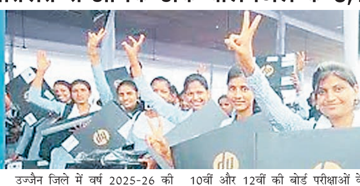
उज्जैन जिले में वर्ष 2025-26 की 10वीं और 12वीं की बोर्ड परीक्षाओं के

प्रतिभाशाली विद्यार्थी प्रोत्साहन योजना अंतर्गत पिछले वर्ष से 1014 अधिक विद्यार्थियों को लैपटाप की राशि उनके खातों में भेजने की तैयारी हो गई है। पिछले वर्ष इस योजना में जिले के 2,103 विद्यार्थी पात्र बने थे और उन्हें लैपटाप की राशि दी गई थी। जिले में इस वर्ष 3117 विद्यार्थियों ने कक्षा 12वीं में 75% से अधिक अंक प्राप्त किए हैं।