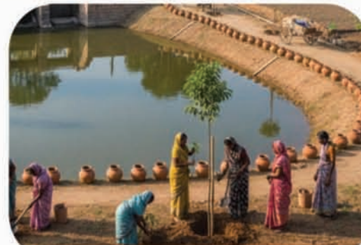
जल सुरक्षा एवं जल संबंधी कार्यों को मिलेगा बढ़ावा