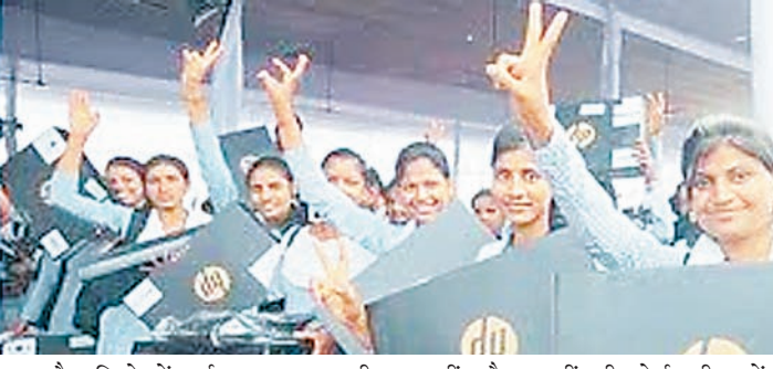
उज्जैन जिले में वर्ष 2025-26 की 10वीं और 12वीं की बोर्ड परीक्षाओं के

प्रतिभाशाली विद्यार्थी प्रोत्साहन योजना अंतर्गत पिछले वर्ष से 1014 अधिक विद्यार्थियों को लैपटाप की राशि उनके खातों में भेजने की तैयारी हो गई है। पिछले वर्ष इस योजना में जिले के 2,103 विद्यार्थी पात्र बने थे और उन्हें लैपटाप की राशि दी गई थी। जिले में इस वर्ष 3117 विद्यार्थियों ने कक्षा 12वीं में 75% से अधिक अंक प्राप्त किए हैं।