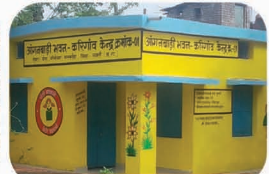
गांवों में मज़बूत बुनियादी ढांचे का निर्माण