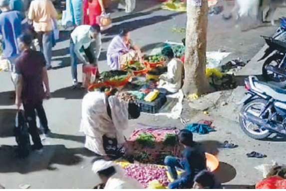
पता तब चला जब उसने अपने गले में चेन नहीं देखी। इसके बाद उसने आसपास तलाश की, लेकिन कोई सुराग नहीं मिला। पुलिस ने अज्ञात आरोपी के खिलाफ प्रकरण दर्ज कर बाजार क्षेत्र के सीसीटीवी फुटेज खंगालना शुरू कर दिया है।