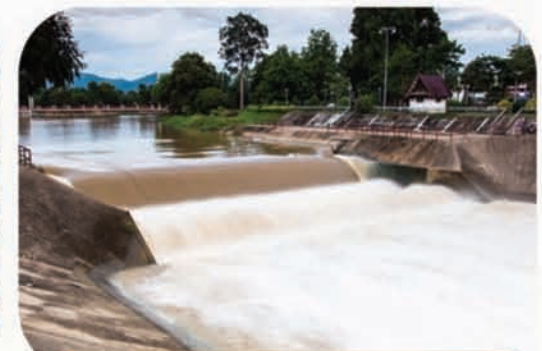
प्रतिकूल मौसमीय घटनाओं से बचाव की तैयारी

125 दिन की रोज़गार गारंटी 1 जुलाई, 2026 से