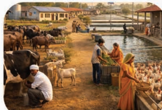
आजीविका के अवसरों का होगा विस्तार