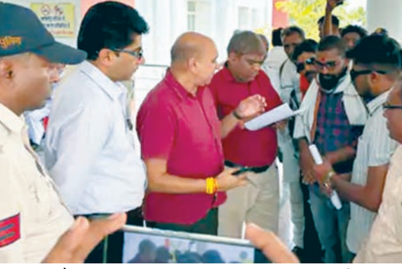
वृद्धि हुई है।

ज्ञापन में नागरिकों ने आरोप लगाया कि पहले सामान्य परिवारों के बिजली बिल 200 से 300 रुपए तक आते थे, लेकिन अब बिना अतिरिक्त बिजली उपयोग के भी 2000 से 3000 रुपए तक के बिल दिए जा रहे हैं। लोगों का कहना है कि घरों में उपयोग होने वाले विद्युत उपकरण पहले जैसे ही हैं, इसके बावजूद बिलों में कई गुना