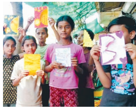
नेकी की दीवार पर बच्चों संग मनाया मदर्स डे