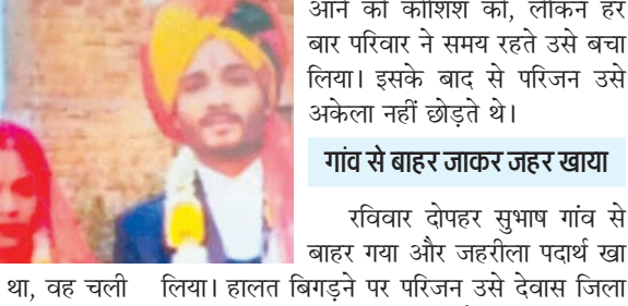
आने की कोशिश की, लेकिन हर बार परिवार ने समय रहते उसे बचा लिया। इसके बाद से परिजन उसे अकेला नहीं छोड़ते थे।

उज्जैन जिले के ग्राम काट बड़ौदा में पत्नी की मौत के सदमे में युवक ने जहरीला पदार्थ खाकर आत्महत्या कर ली। पत्नी की मौत के बाद वह लंबे समय से परेशान था। परिजन के अनुसार वह हमेशा कहता था, वह चली गई अब मैं भी जाऊंगा।