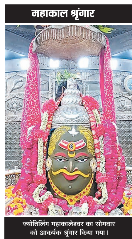
ज्योतिर्लिंग महाकालेश्वर का सोमवार को आकर्षक श्रृंगार किया गया।