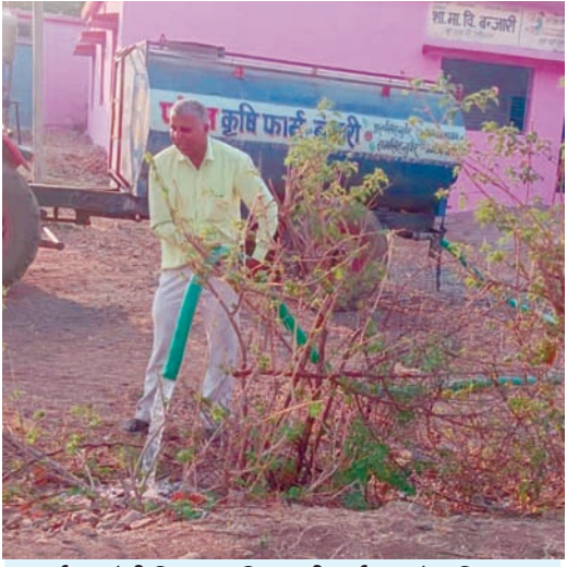
पर्यावरणप्रेमी शिक्षक परिहार की पर्यावरण के प्रति लगन