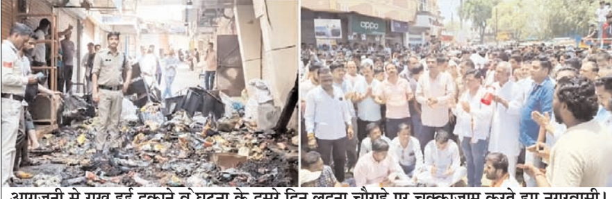
आगजनी से राख हुई दुकानें व घटना के दूसरे दिन लड्डूना चौराहे पर चक्काजाम करते हुए नगरवासी।

मंदसौर जिले के सीतामऊ बस स्टैंड क्षेत्र में रविवार देर रात हुए एक किराना दुकान से शुरू हुई आग ने देखते ही देखते विकराल रूप धारण कर लिया और आसपास की करीब सात दुकानों को अपनी चपेट में ले लिया। इस हादसे में एक करोड़ रुपये से अधिक के माल के जलकर खाक होने का अनुमान है।