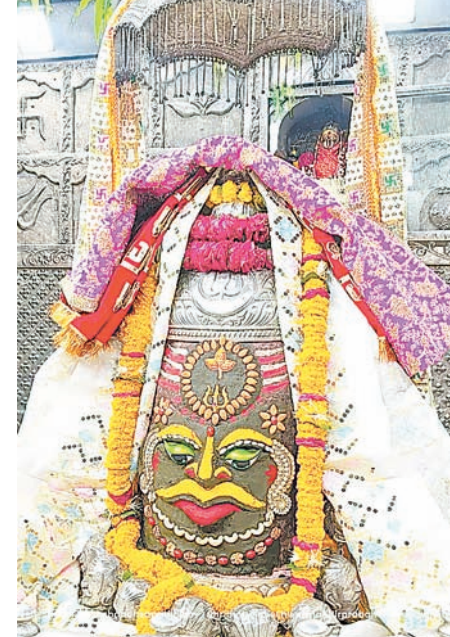
ज्योतिर्लिंग महाकालेश्वर का शनिवार को आकर्षक श्रृंगार किया गया।