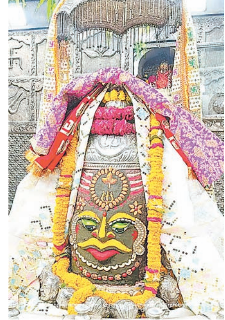
ज्योतिर्लिंग महाकालेश्वर का शनिवार को आकर्षक श्रृंगार किया गया।