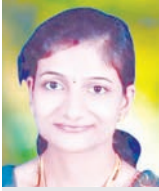
कृति आरके जैन, (दैनिक अवन्तिका)

जब जीवन पहली बार ममता की छाया में सांस लेना सीखता है, तभी माँ का अर्थ समझ आता है। मई के दूसरे रविवार पर आने वाला यह दिन माँ के निस्वार्थ प्रेम और अथाह त्याग का वह उजाला है, जिसमें हमारे अस्तित्व का सच्चा अर्थ साफ दिखाई देता है। भारत समेत अमेरिका,